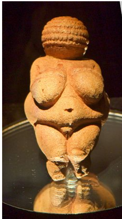
Venus de Willendorf

La más famosa es la Venus de Willendorf, pero también sobresalen las de Lausell, Lespugne y Dolní Vestonice.