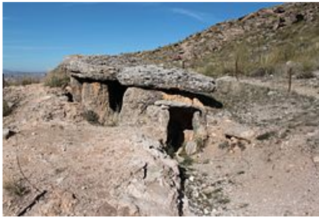
Dolmen de Gorafe, Granada