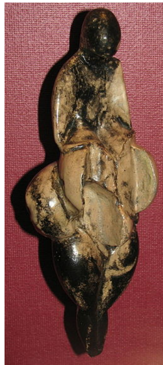
Venus de Lespugne