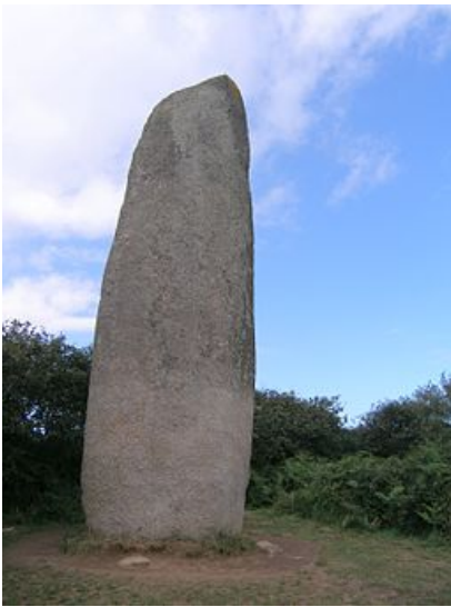
Menhir de Kerloas, Francia

Imagen en Wikimedia Commons , Licencia CC