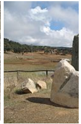
Cromlech de La Poca, Francia