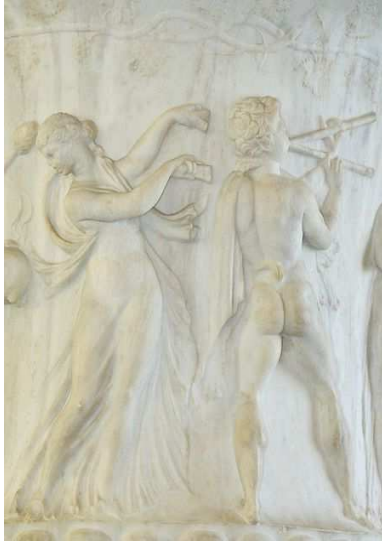
Escena de canto y danza

La palabra lírica procede de lira, y definía en Grecia a toda composición que se ejecutase acompañada de este instrumento. Pero no solo fue la lira el instrumento utilizado: las canciones podían incorporar también música de flauta, y algunos de percusión como crótalos o tímpanos. En todo caso, siempre este tipo de poesía iba acompañada de música, y muchas veces de danza.