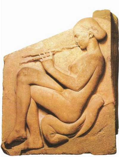
Muchacha tocando la flauta. 450 a.C.

¿Cómo nació la lírica como género literario? ¿Qué era la lírica en sus comienzos?