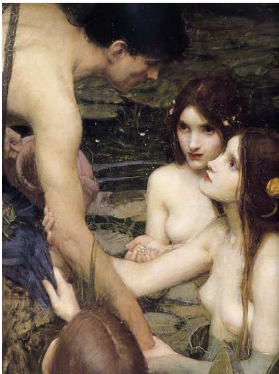
J.W. Waterhouse Hilas y las Ninfas (detalle)

el eco de la nube, azul la cabellera. Ahora soy la nostalgia, la humedad, el hongo y la agonía y pudro a quien se acerca.