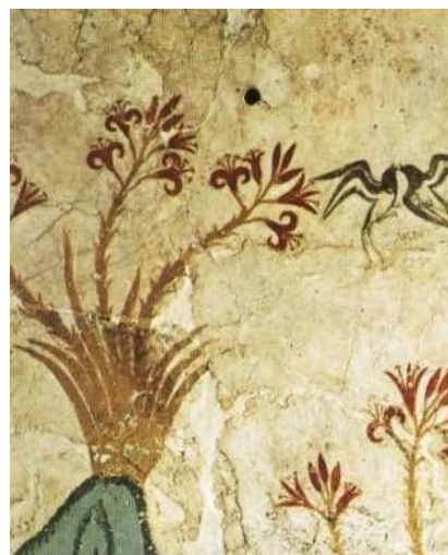
Fresco de la primavera. A Imagen de domin

Texto adaptado por Javier Almodóvar en www.antiquarius.es