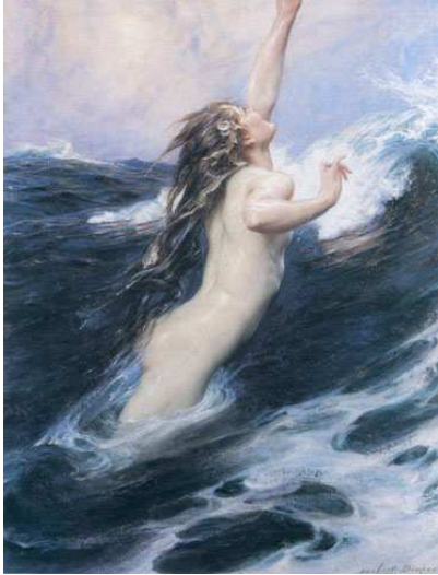
Herbert James Draper Los peces voladores Imagen de dominio público