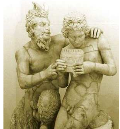
Pan enseña a Dafnis a tocar la siringa Copia de una escultura de Heliodoro. 100 a.C. Imagen de dominio público

La lírica en Grecia nació cumpliendo una función. Lírica y funcionalidad parecen términos contrapuestos: el arte, si tiene alguna función, es la estética, el recreo del espíritu y los sentidos, y la lírica es quizá el arte menos “útil” de todas las artes.