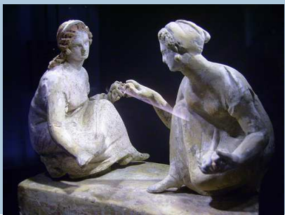
Jugando a las tabas

Uno de los participantes la quedaba y los demás lo rodeaban, preguntando hasta llegar a la frase clave que era la señal para que todos salieran corriendo y el que la quedaba atrapaba a alguno de ellos, que la quedaba a su vez. Similar al "Tula" (abreviatura de "tú la quedas"); el chico o chica al que le tocaba quedarla se le decía: "tú la das, tú la llevas, dásela a quien tú quieras".