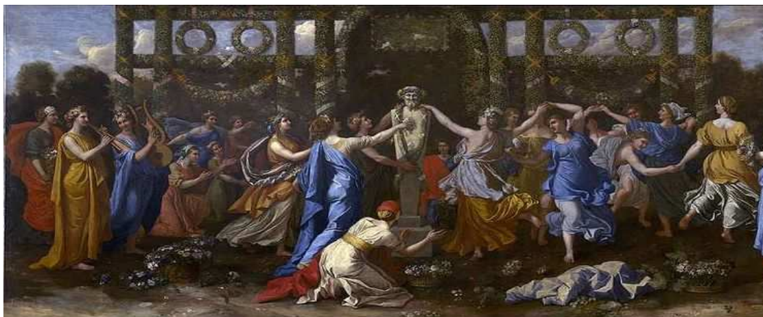
Nicolas Poussin, Himeneo . Imagen de dominio público.

Examina el significado de los términos anteriores y deduce: