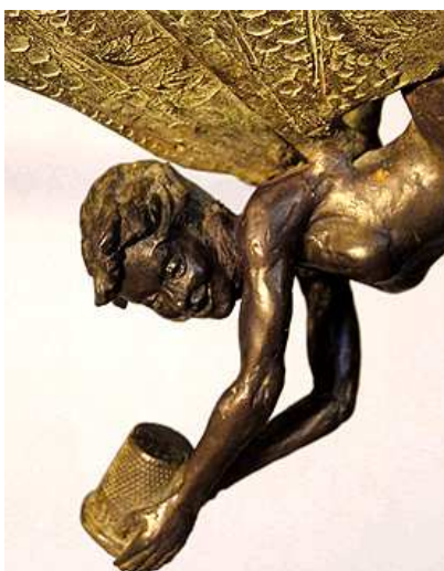
Diarmuid Byron O'Connor