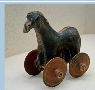
Pequeño juguete. 950-900 a.C.

La literatura y el arte mencionan con frecuencia juguetes y juegos. Aristóteles habla de muñecos y las figuras de terracota muestran con frecuencia niños jugando a ephedrismos , una especie de caballito, y juegos parecidos se ven en la cerámica. Los arqueólogos también han encontrado pequeños juguetes. Sin embargo, aros y pelotas se hacían de madera u otros materiales fácilmente degradables y no conservamos ninguno de ellos. Juegos de los que tenemos noticia por fuentes literarias o artísticas no nos proporcionan información acerca de sus reglas. Por ejemplo, sabemos que se practicaba un juego similar al jockey por un relieve en la base de una escultura del período arcaico, pero no sabemos exactamente en qué consistía. Lo mismo ocurre con los juegos de mesa.