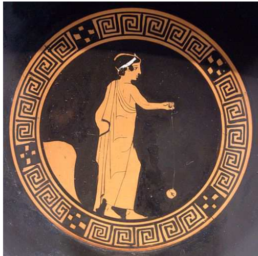
Jugador de yoyó. 440 a.C. Imagen de dominio público.