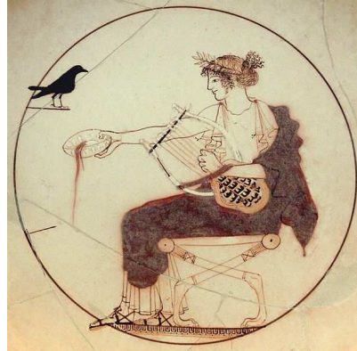
Apolo con una lira. 460 a.C. Imagen de Fingalo. Licencia CC