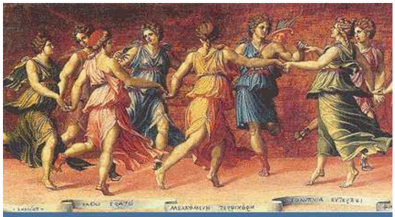
Danza de las Musas. Imagen de Baldassarre Peruzzi. Dominio público

En los textos de Homero se encuentran testimonios de la existencia de una lírica popular, oral: un peán que entonan los aqueos en honor de Apolo para que los libre de la peste que asola al campamento aqueo; trenos con ocasión de las exequias de los héroes; una escena de boda en la que se canta un epitalamio; un canto de cosecha... Cantos corales o individuales acompañados por un coro. La lírica en estos casos cumple una función ritual, no de entretenimiento. Las danzas son comunes también entre los dioses: se habla, por ejemplo, de los bailes de Ártemis y sus ninfas, con los que se compara el de Nausícaa con sus compañeras. Algunas de estas danzas eran miméticas, y los participantes representaban a personajes de todo tipo: dioses, ninfas, sátiros, héroes y heroínas, incluso animales. Hesíodo habla de los cantos de las Musas y en la cerámica hay también testimonios de cantos y de bailes.