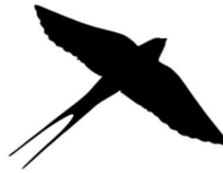
Imagen de Nevit Dilmen. Licencia CC

Llegó, llegó la golondrina que trae la bella estación, el bello año con el vientre blanco, con la espalda negra. Saca una tarta de fruta de tu rica casa y una copa de vino y un cestillo de queso; el pan candeal y el de sémola no serán rechazados... Nos vamos o cogemos algo? si nos vas a dar algo; y si no, no dejaremos; Nos llevaremos al puerta, o el dintel o la mujer que está sentada fuera. es pequeña, la cargaremos fácil. Y si traes algo, tráenos algo grande. Abre, abre la puerta a la golondrina, que no somos viejos, sino pequeñines.