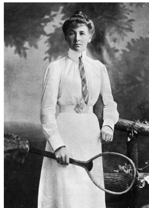
Charlotte Cooper

Elia María González-Álvarez y López-Chicheri, más conocida como Lilí Álvarez, (1905-1998) fue una deportista, escritora y periodista española. Practicó numerosos deportes, como esquí, alpinismo, equitación y billar, y pilotó coches de carreras, pero destacó sobre todo como tenista y patinadora.