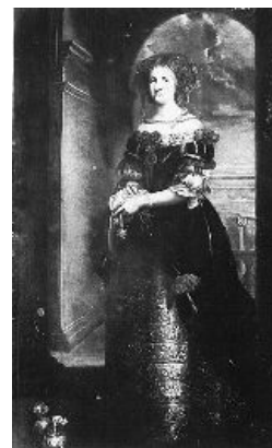
Imagen en Wikimedia Commons de autor desconocido . Dominio público