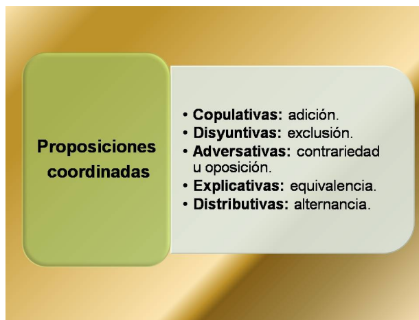
Gráfico de creación propia.

Observa en el siguiente esquema las distintas relaciones que pueden establecerse entre las proposiciones coordinadas: