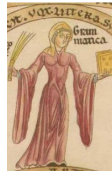
Imagen de Herrad von Landsberg en Wikimedia Commons bajo Dominio público