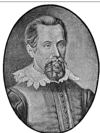
6. Kepler.

Defendió que el Sol estaba en el centro del Universo, provocando el paso de la visión geocéntrica del Universo (la Tierra es el centro) a la heliocéntrica (el sol es el centro) . Con elló simplificó el sistema de explicación anterior, dando una imagen más sencilla del Universo. Ese cambio de imagen se ha conocido como Revolución copernicana . Aquí tienes dos claros e interesantes vídeos que resumen muy bien lo más importante de su obra y la importancia de lo que propuso.