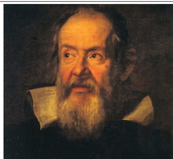
7. Galileo.

Defendió la concepción copernicana del Universo (el Sol es el centro). Construyó telescopios para la observación astronómica, realizando descubrimientos en esta ciencia. Fue condenado por la Iglesia , por lo que tuvo que retractarse de sus ideas. Elaboró un método aplicando las matemáticas a los datos obtenidos por la observación de la naturaleza . Su método consistía, básicamente en: