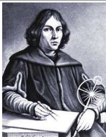
5. Copérnico.

Le vamos a dedicar el siguiente tema de esta unidad, pero es interesante esbozar aquí una de las principales características del Renacimiento. Nos referimos a los comienzos de una Revolución científica que se dio en esta época. Poco a poco se fue imponiendo una visión mecanicista del universo . Es decir, que se va entendiendo éste como una máquina, y a él se pueden aplicar las matemáticas y la experiencia.