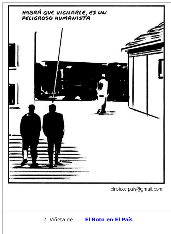
2. Viñeta de El Roto en El País

¿Qué querrá decir la viñeta que tienes aquí? Hemos visto en el apartado anterior que el humanismo es una de las características principales del Renacimiento. El conocimiento de la cultura griega clásica se amplió muchísimo respecto a la Edad Media y se conocieron las obras de Platón y Aristóteles con mejores traducciones. Pero, ¿por qué hablará la viñeta de la necesidad de vigilar, siglos después, a un "peligroso humanista"?