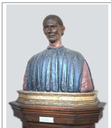
4. Busto de Maquiavelo.

Piensa algún problema político concreto, el que quieras. Sea el que sea el que has elegido podrás pensar también que tiene soluciones extremas y otras más comedidas. Por ejemplo, podría acabarse con el paro expulsando de un país a todos sus parados. O podría hacerse gestionando de otra manera los servicios de empleo. La primera es una solución demasiado drástica, según la cual, el fin de acabar con el paro justificaría el medio de expulsar a los parados. ¿A que habías escuchado eso de " el fin justifica los medios "? Pues vamos a ver que esa idea procede de un pensador de esta época. Justo del que tienes en la fotografía de la izquierda: Nicolás Maquiavelo .