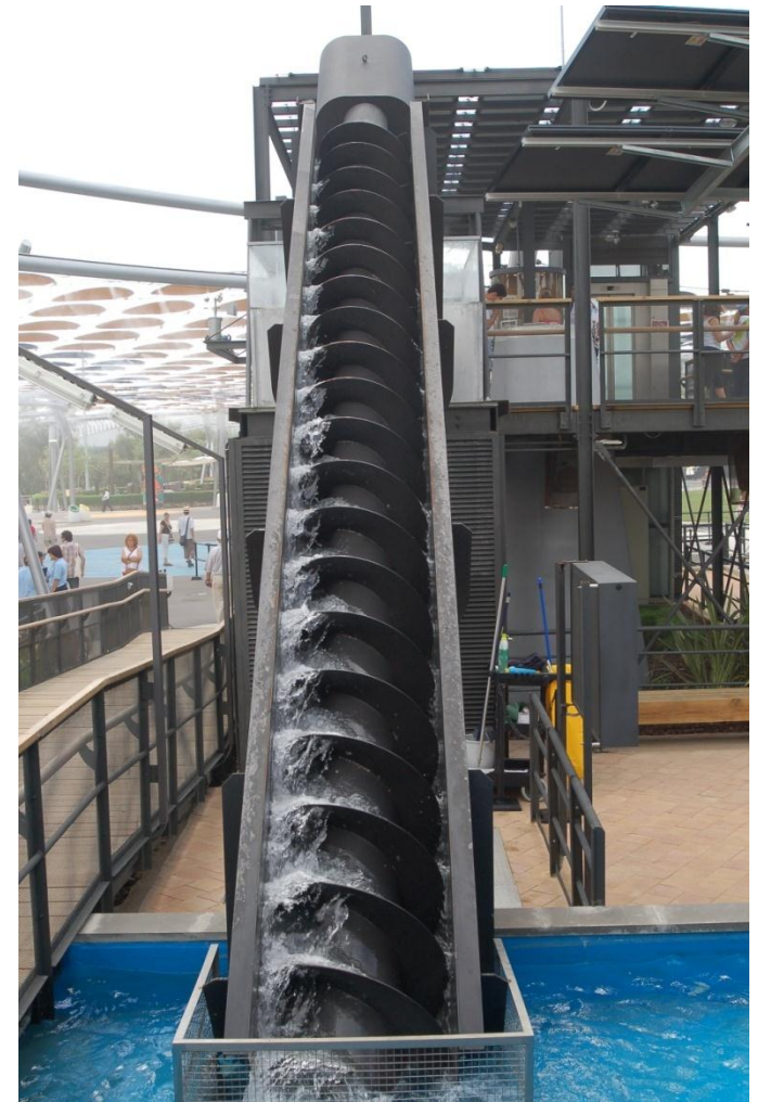
Imagen 01. Elaboración propia

Definimos una máquina como una combinación de mecanismos, adecuadamente organizados, alimentados con un cierto tipo de energía, que es transformada en otra, produciendo un efecto deseado.