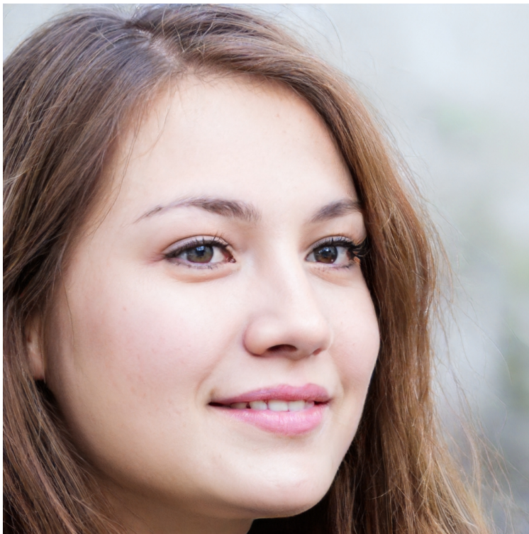
Imagen creada con IA en la web thispersondoesnotexist.com < https://thispersondoesnotexist.com/ > . Persona. (CC0 < http://creativecommons.org/publicdomain/zero/1.0/deed.es > )

A veces resulta difícil comenzar a crear desde la nada. ¿No se te ocurre ningún rasgo propio de tu personaje? ¿No quieres transferirle características tuyas? ¿No consigues empezar la tarea? Te proponemos que visites el siguiente enlace < https://thispersondoesnotexist.com/ > , donde encontrarás una herramienta de Inteligencia Artificial fascinante: se trata de una página muy sencilla, en la que tan sólo aparece un rostro, como puedes comprobar. Pero, cada vez que actualices el navegador, verás que aparece una cara diferente, ¡y ninguna de ellas existe! Todas son el resultado de la creación automática realizada por un motor de Inteligencia Artificial. Puedes actualizarla tantas veces como quieres, ¡y nunca se repetirán las imágenes!