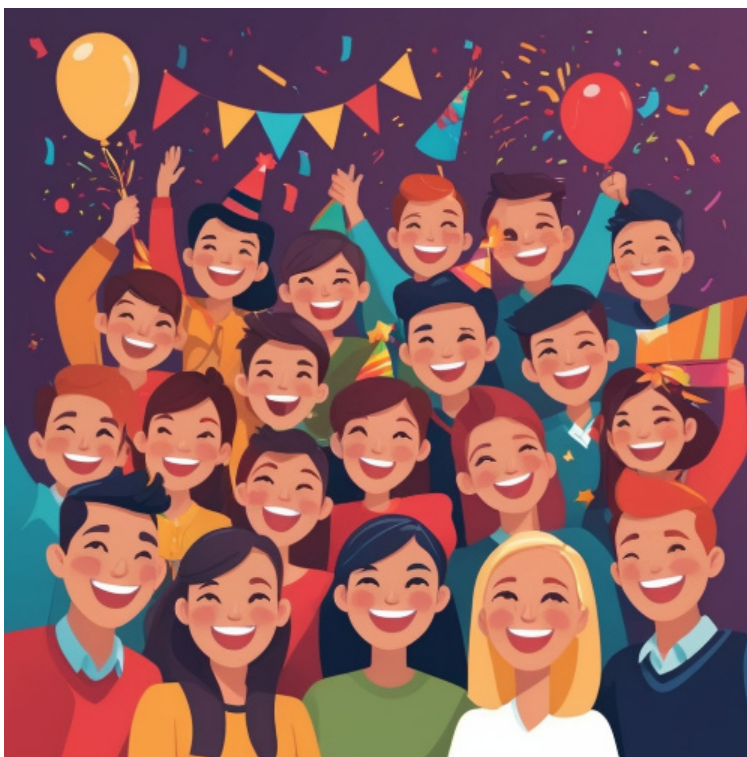
Imagen de elaboración propia generada con Leonardo.AI < https://leonardo.ai/ >

Después de trabajar en este primer bloque diferentes aspectos de las artes escénicas, desde sus orígenes hasta oriente; de descubrir diferentes manifestaciones, y de proponeros ejercicios de improvisación, os toca aplicar lo aprendido y crear vuestro propio personaje. ¿Quién sabe si será el protagonista de una obra de teatro de éxito? No es necesario que imagines la trama ni el detalle del contexto. Ni siquiera el género o subgénero en el que se insertará. Comenzaremos por lo más sencillo, ¡para convertirte en guionista de una obra de ficción!