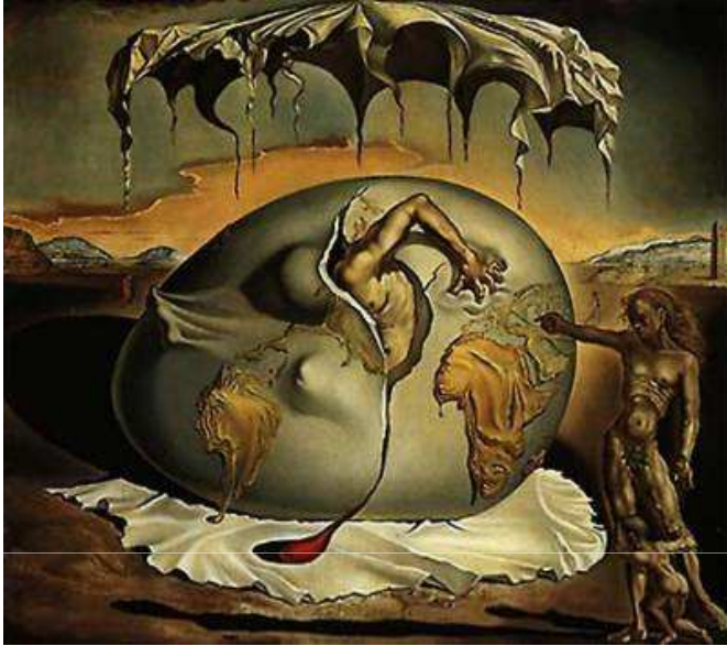
Obras de Dalí (arriba), Picasso (debajo) y Gargallo (a la derecha).