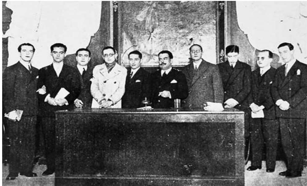
Imagen de algunos integrantes de la Generación del 27