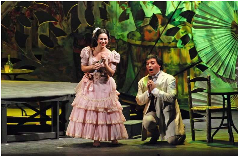
Representación de la zarzuela Doña Francisquita