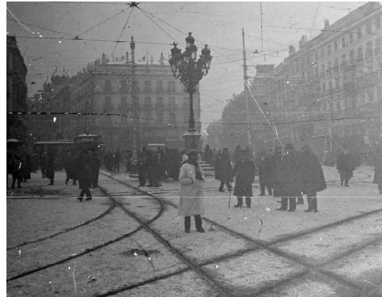
Puerta del Sol de Madrid en 1910.