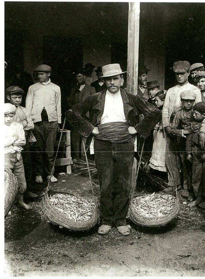
Vendedor de boquerones en Málaga (1905).