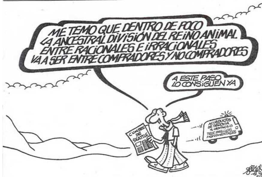
Imagen aparecida en el periódico El País