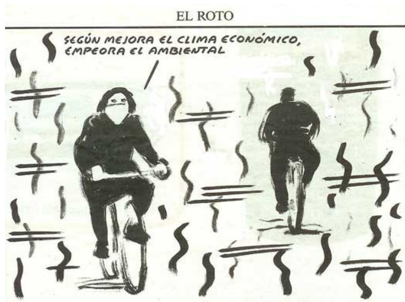
Imagen de El Roto procedente de El País

En la actualidad, como veremos más adelante en este curso, uno de los mayores retos a los que se enfrenta la Economía es conseguir frenar el enorme impacto que la actividad económica tiene sobre estos recursos: sobreexplotación, contaminación, desertización y cambio climático entre otros.