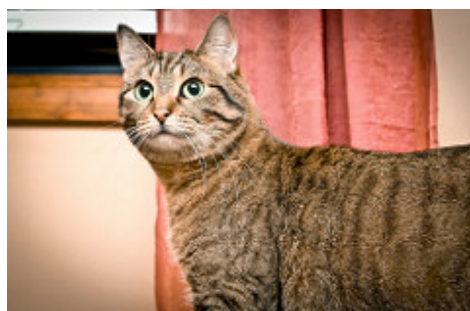
Imagen de Val D'Aquila en Flickr . Licencia CC