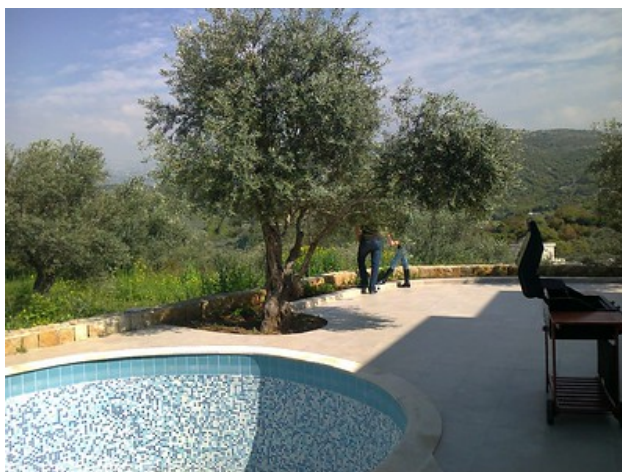
Imagen de Gilbert-Noël Sfeir Mont-Liban en Flickr . Licencia CC