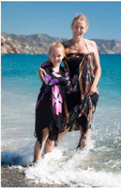
Imagen de Barney Moss en Flickr . Licencia CC