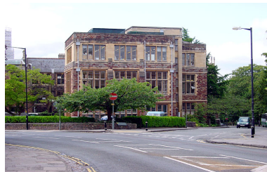
Imagen de wikimedia de Linda Bailey bajo licencia de Creative Commons