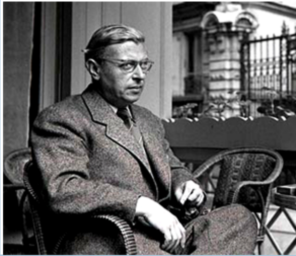
Jean Paul Sartre.

Imagen de Hello world en Wikimedia Commons . Dominio público