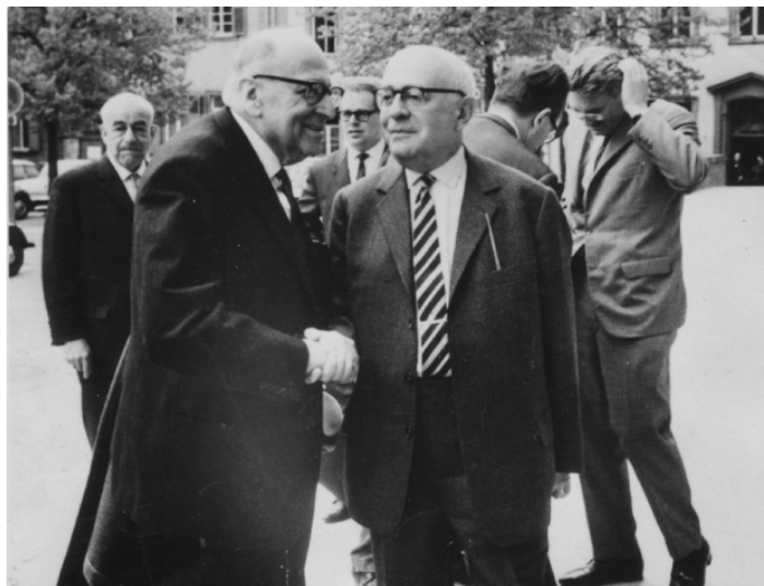
Horkheimer y Adorno