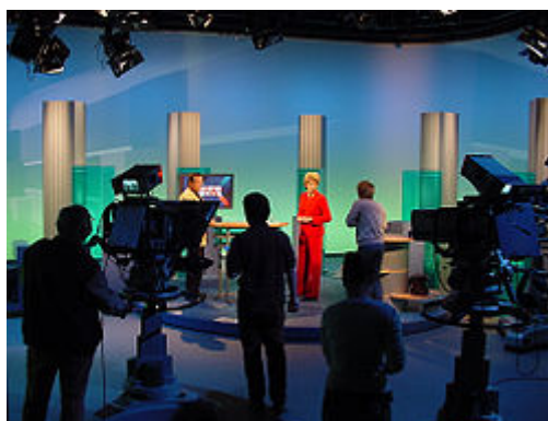
Plató de televisión.