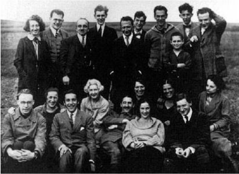
Foto del grupo de miembros del Instituto para la Investigación Social, 1923