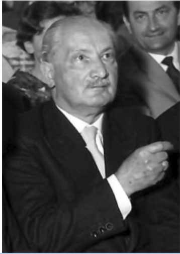
M. Heidegger

Destaca como primordial la pregunta por el ser. Se trata de la cuestión inicial de la filosofía, olvidada de forma progresiva y sustituida por la pregunta por el ente, por lo existente. Es una cuestión dirigida al ser humano y que está vinculada a la de la propia existencia humana y su sentido, ya que es al ser humano al único que el ser se le revela ante sí mismo en dicha pregunta.