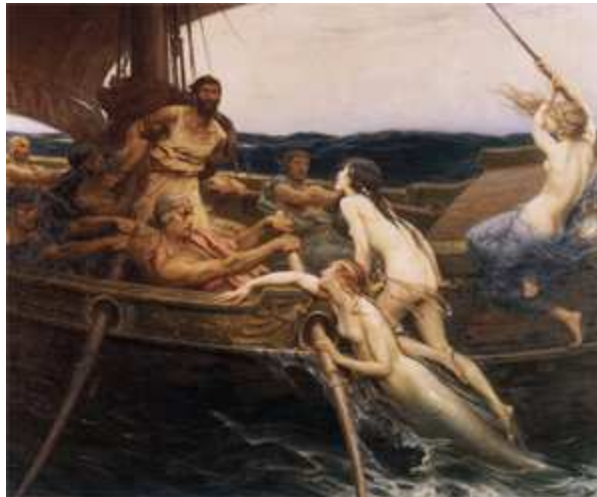
Ulises atado al mástil oyendo a las sirenas

Imagen de Hermes James Graper . Dominio Público