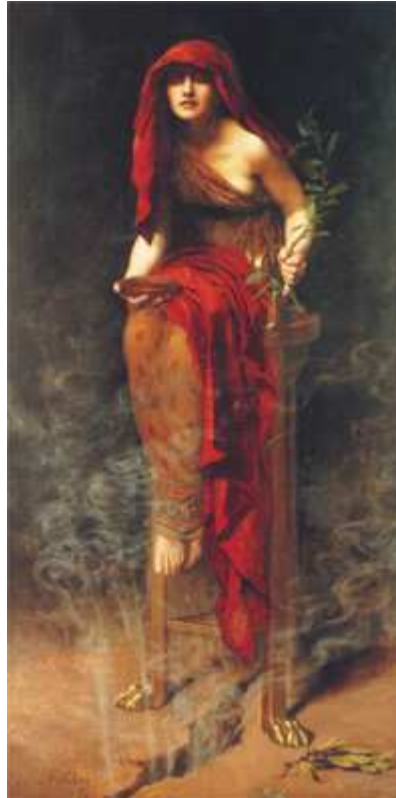
Pitonisa de Delfos

Como hemos visto en el apartado anterior, los mitos son relatos con los que se trata de explicar la realidad . Pero lo hacen de una manera un tanto especial. Probablemente no te convenza la explicación que da el mito de Perséfone sobre el origen de las estaciones. ¿Qué hay en ese modo de explicar que ya no nos vale? Bien, eso es lo que vamos a analizar en este apartado.