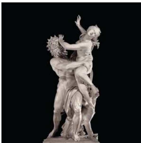
Hades raptando a Perséfone

Quando escribo esto es invierno, un invierno duro como hace años no se veía. Pero con toda certeza podemos afirmar que las nieves del invierno dentro de unos meses darán paso a las temperaturas suaves de la primavera. Y unos meses después llegarán los rigores del verano. Al que sucederán los días del otoño que se empeñan en arrancar las hojas a los árboles. Y sin darnos cuenta, desembocaremos de nuevo en el invierno. Y así año tras año. No sé si te habrás preguntado de dónde viene este curioso ciclo . Pues los antiguos griegos ya se lo preguntaron. Y se dieron una explicación para ello.