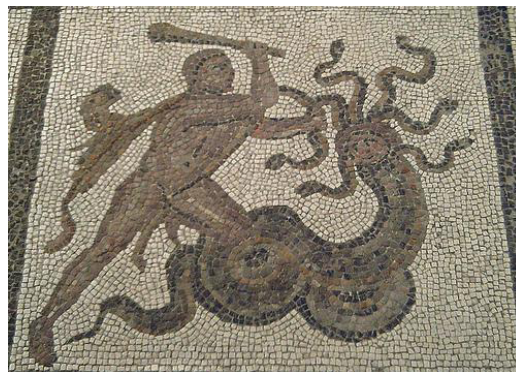
Heracles vence a la Hydra de Lerna

Lo mismo que para cualquiera de nosotros es conocido que Colón descubrió América o que existió un caballero castellano al que se conocía como el Cid , cualquier griego estaba familiarizado con los trabajos de Heracles a quien, con bastante probabilidad, juzgaría como un personaje real aunque nunca se hubiese cruzado con él en la calle.