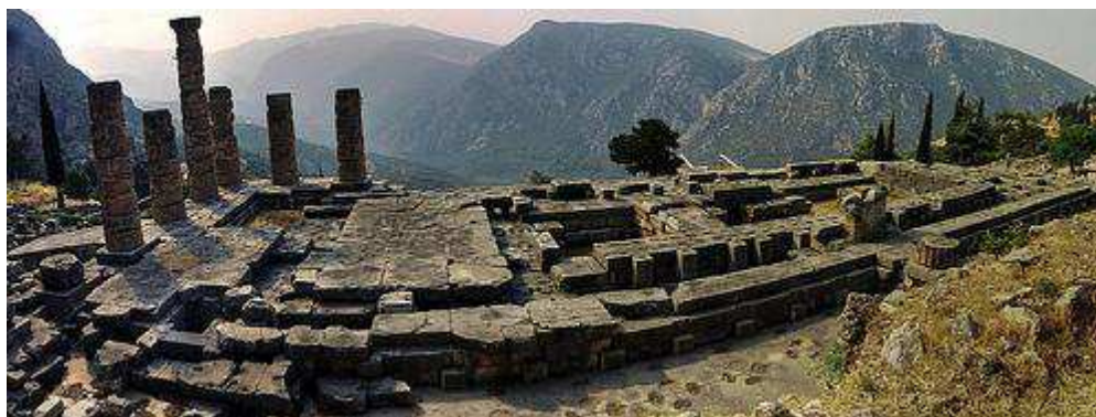
Oráculo de Delfos