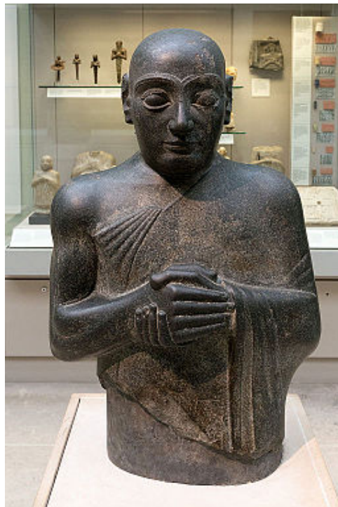
Estatua de Gudea, sobre el 2.000 a.C.