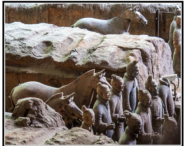
Caballos y caballeros.