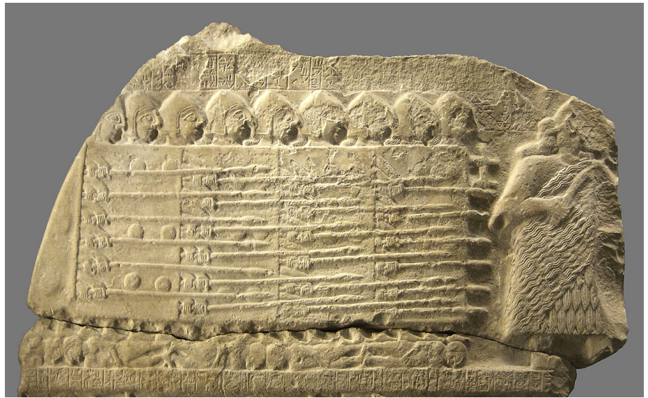
Estela de los Buitres