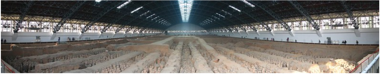
Panorama de Xian.

Todas las figuras son el resultado de la composición de distintos moldes de terracota gris huecos y que posteriormente de policromaron, pero de eso vamos a hablar más tarde.