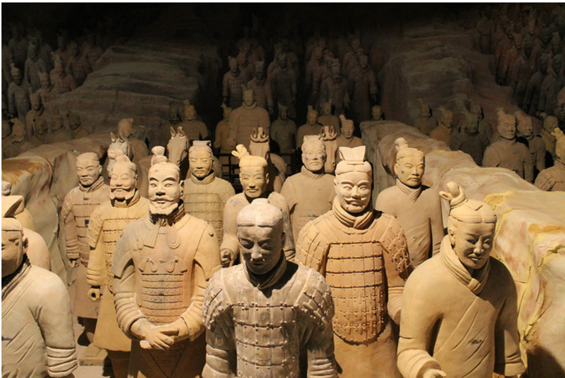
Guereros de Xian

Observa la imagen y selecciona las características que creas convenientes de las que te presentamos a continuación