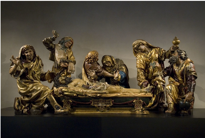
Santo entierro, de Juan de Juni