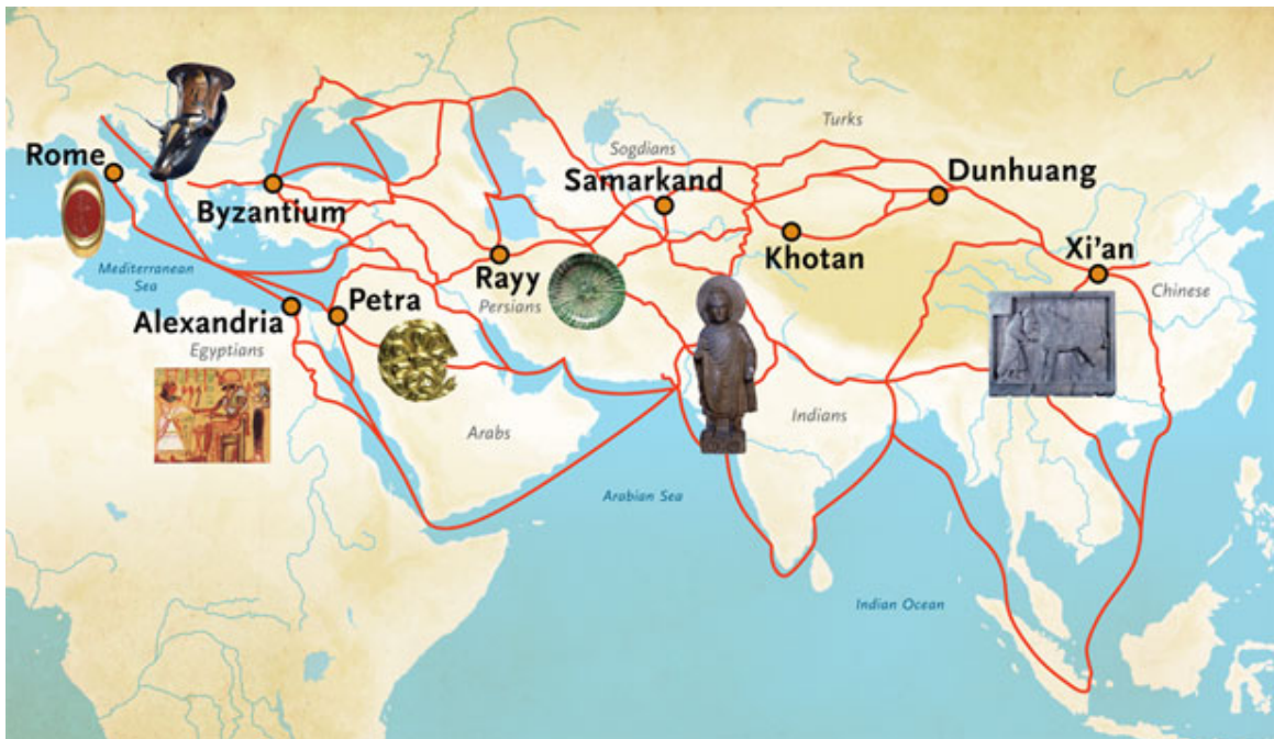
Ruta de la seda