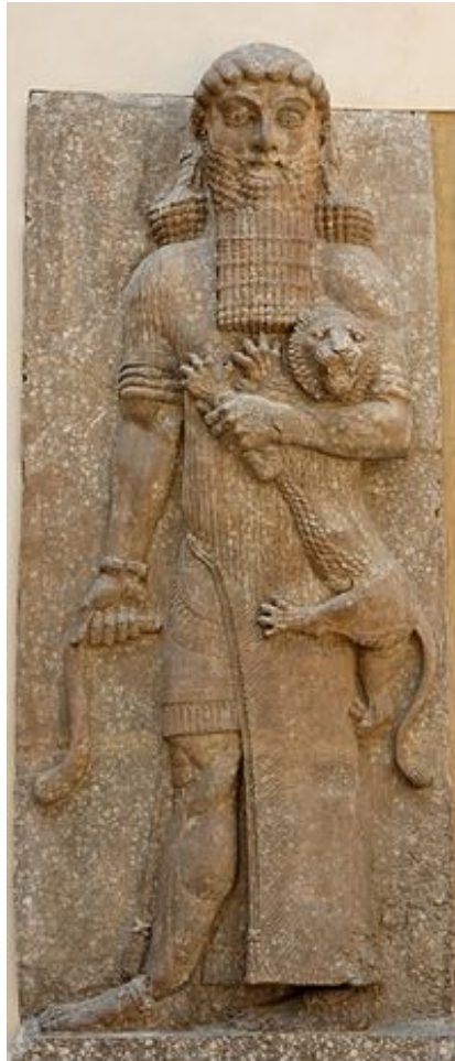
Figura de Gilgamesh del palacio de Sargón II.