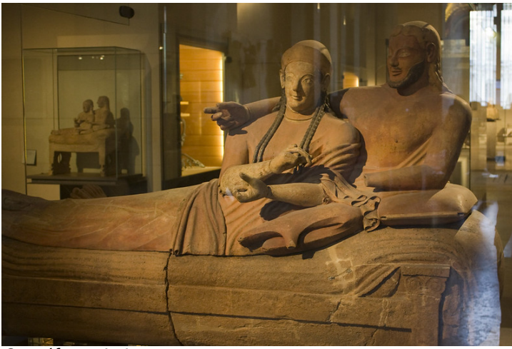
Sarcófago de los esposos