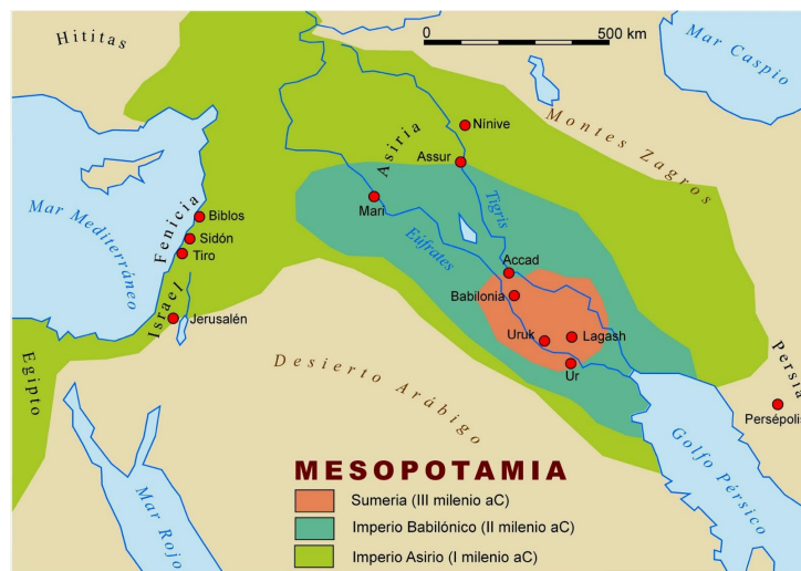
Mapa de Mesopotamia

Estas dos antiguas civilizaciones ocupaban el lugar de lo que conocemos hoy en día como Oriente Próximo .