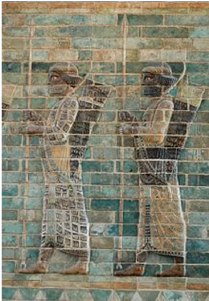
Friso de los arqueros.