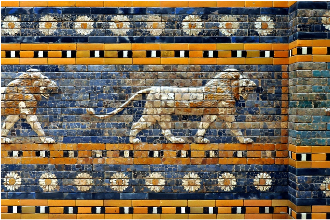
Detalle Puertas de Istar.