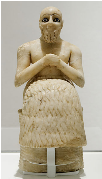
Intendente Ebih-il de Mari