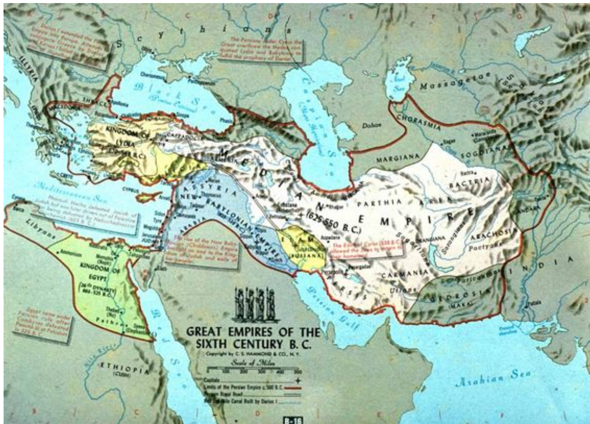
Mapa del imperio persa durante el reinado de Ciro "El Grande"

avenida de columnas con capiteles en forma de animales. Destacan el palacio de Darío o la tumba de Ciro el Grande.