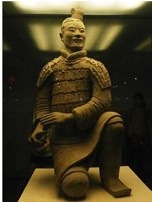
Guerrero de Xian

Imagen de Penn museum en Pinterest , Licencia CC