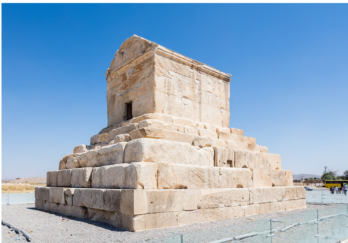
Tumba de Ciro I en Pasagarda.

sobre una plataforma y estaban cerrados. Las columnas, con capiteles de animales (son famosos los tauriformes) tenían mucha importancia porque en buena parte de los palacios se encontraba, según el modelo egipcio , una sala hipóstila o bien avenidas flanqueadas de columnas. El palacio de Ciro en Pasagarda puede representar el modelo típico; los palacios edificadas por Darío I y sus sucesores en Persépolis tienen, por decirlo así, un carácter mucho más teatral y son la puesta en escena del poder de los soberanos: puertas como arcos triunfales, avenidas, escalinatas, salas hipóstilas, techo de madera ricamente decorados... todo debía contribuir a exaltar el poder de los señores aqueménidas. Es evidente, por ejemplo, el contraste con la tumba de Ciro el Grande en Pasagarda 528 a. C (dentro del recinto imperial), una estructura en piedra bastante sencilla, que permanece casi intacta. Se trata de un pequeño edificio (un edículo) que se alza sobre una plataforma de piedra; la altura total no llega a los once metros. El edificio está rematado por un frontón, que tal vez sigue el modelo griego, con cubierta a dos aguas. Alejandro Magno debió quedar impresionado por la tumba, pero no por su magnificencia, sino por su sencillez, porque sabemos que mandó restaurar la tumba. Muy diferente es la tumba de Artajerjes , que se realizó siguiendo modelos egipcios: se trata de un hipogeo excavado en roca que forma parte de un gran conjunto funerario cercano a Persépolis.