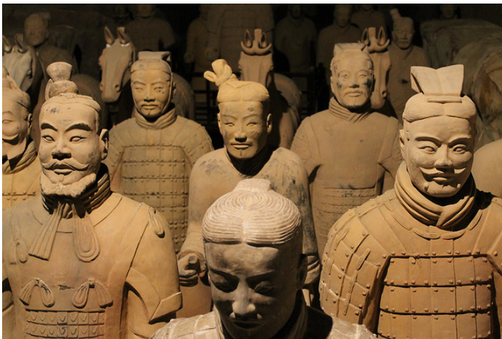
Los guerreros de Xian

Come ves, las casualidades existen, y fruto de esta maravillosa suerte el imponente conjunto de más de mil piezas a tamaño natural que representa al ejército de Qin Shi Huandi fue descubierto en 1974. El gran grupo de soldados que apareció representa a todos los cuerpos de la milicia del emperador , todos diferentes y alineados para la batalla. Podríamos ir mirando uno por uno y no encontraríamos dos posturas iguales, ni dos rostros, ni peinados, ni indumentaria, ni gestos, etc. Pero si podríamos destacar su acentuado realismo..