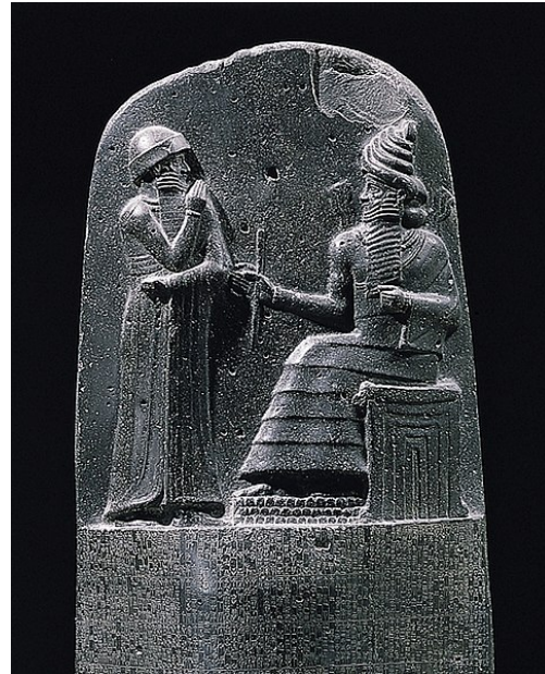
Código de Hammurabi