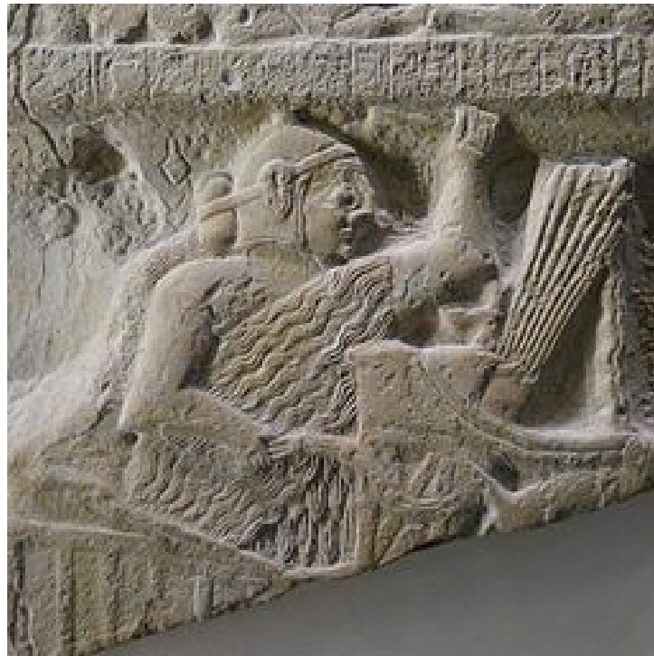
Estela de los buitres