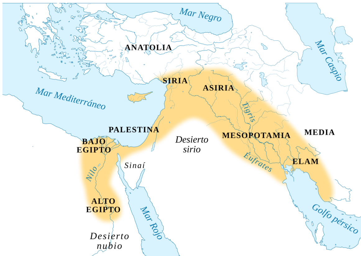
Mapa del creciente fértil

¿Sabías que el nombre de Mesopotamia procede del griego meso-potamía que significa "entre ríos", traducción del persa antiguo Miyanrudan "la tierra entre ríos" o del siríaco beth nahrin "entre dos ríos"?