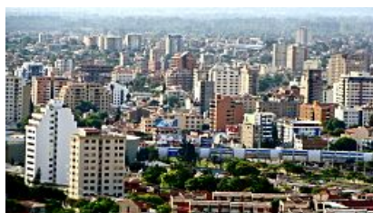
Imagen en Wikimedia Commons de Pasaminutoa. Licencia CC

Observa estas dos imágenes. ¿Cuál te gusta más? ¿Dónde irías a pasar unas vacaciones? ¿Qué diferencias encuentras entre el mundo que te rodea y otros lugares para vivir? ¿Qué palabras usarías para explicar las características de tu barrio, tu pueblo o tu ciudad? Ya nos irás contando a lo largo de esta unidad. En este bloque aprenderás a distinguir entre los diferentes tipos de palabras y a usar las más adecuadas para hacer descripciones de lugares. ¿Te parece difícil? No te preocupes, los contenidos y actividades que irás encontrando te ayudarán en esta tarea.