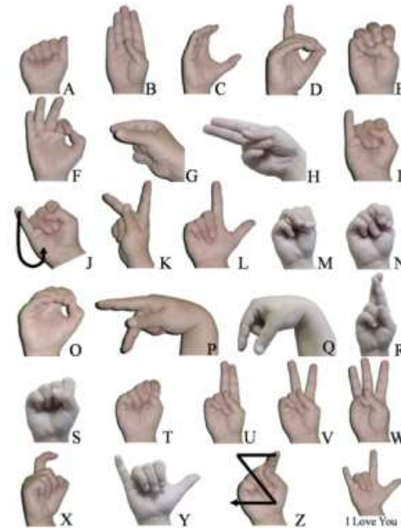
Imag.3 Autor: Cwterp Licencia: Dominio Público