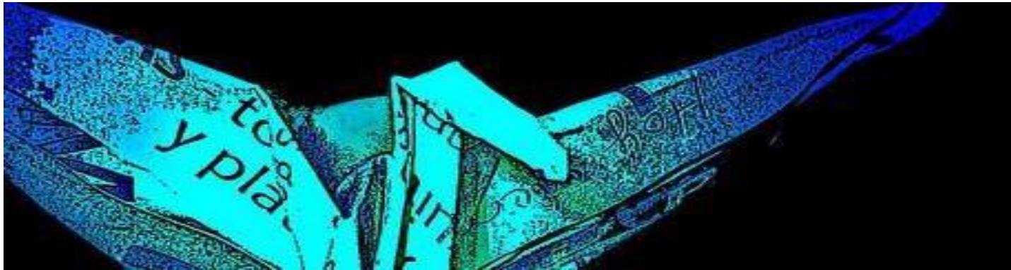
Imagen de Estafilococa en Flickr bajo licencia de CC

El cambio semántico consiste en la variación del significado de un término debido a diversas causas. A algunos de esos cambios se les denomina tabú y eufemismo.