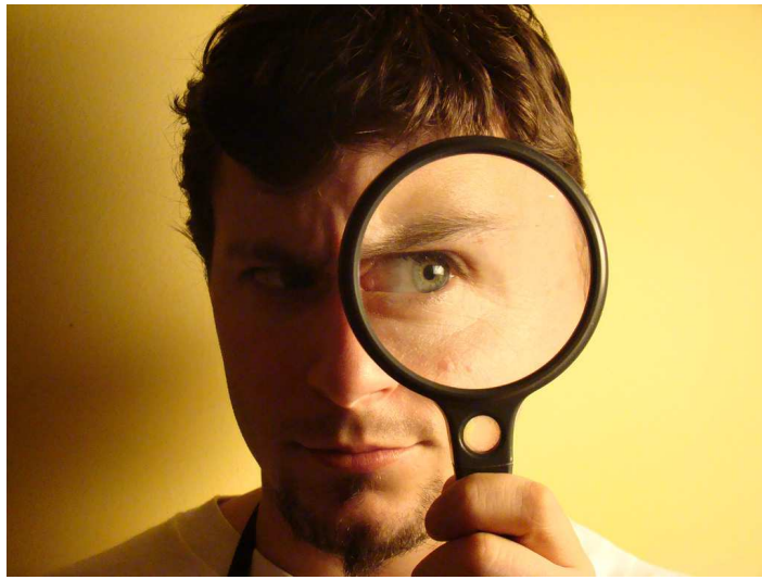
1. Magnifying Glass. Foto en Flickr de andercismo . Bajo licencia Creative Commons

¿Qué te dice la pregunta del título del tema? ¿ Cómo sabes las cosas que sabes? ¿ Cuántas cosas sabemos? ¿ Qué significa saber algo? ¿Es lo mismo creer alguna cosa que saberla? ¿Por qué nos empeñamos en querer razonar las cosas? ¿Cuántas veces has oído o dicho que alguien tiene o no tiene razón? ¿Qué es tener razón? ¿Cuándo es razonable algo que hacemos?