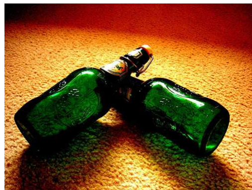
9. Fotografía en Flickr de wakalani . Bajo licencia Creative Commons.