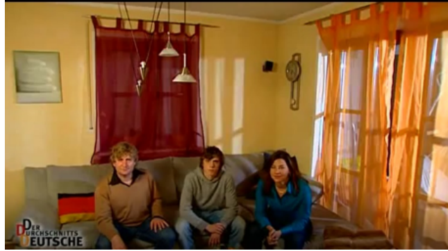
Imagen y Podcast en Youtube.com . Licencia educativa