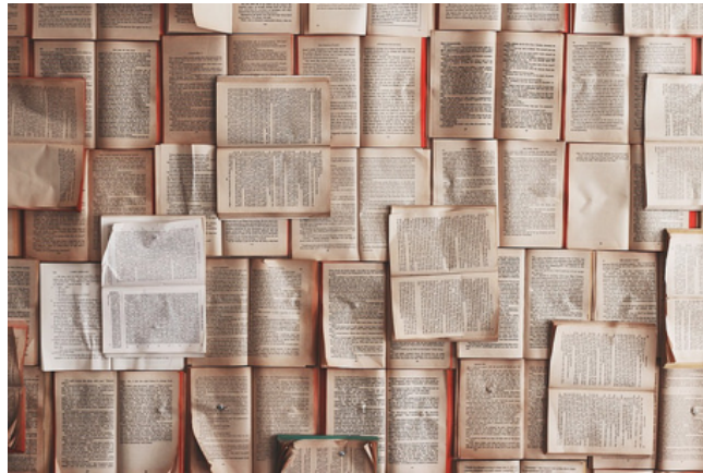
Biografando a delicada arte de escrever biografia - 1