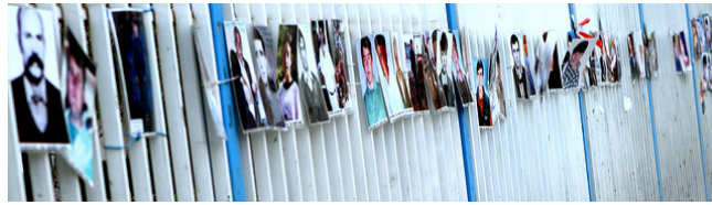
Kosovo - Pristina

Imagen de Cindy Dam en Flickr . Licencia CC