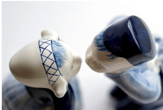
the kissing couple in Delft blue

Imagen de Pieter van Marion en Flickr . Licencia CC