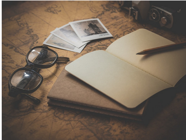
Biografando a delicada arte de escrever biografia - 4