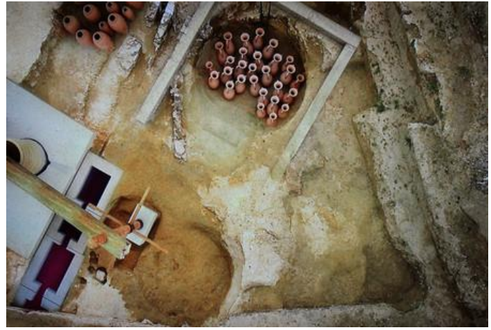
prensa y bodega de ánforas

FORO , en época de Nerón, s. I n.e., se construyó encima del lagar un foro rodeado de un pórtico con muro perimetral.