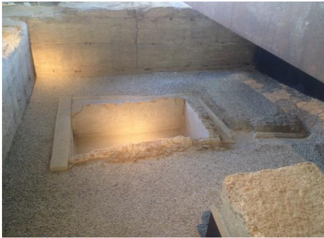
fuente del foro

MURALLA de diversos períodos: fortaleza con puerta monumental de Yusuf al-Mansor, finales s. XII.