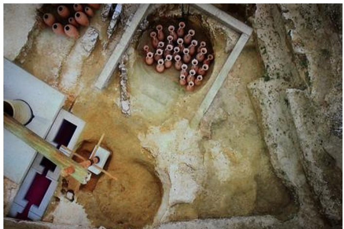
prensa y bodega de ánforas