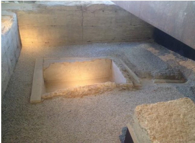
fuelle del foro

MURALLA de diversos períodos: fortaleza con puerta monumental de Yusuf al-Mansor, finales s. XII.