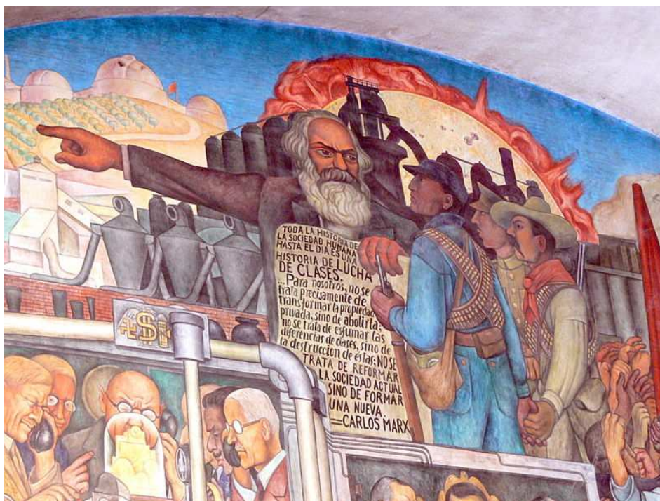
Imagen de Diego Rivera en Wikimedia Commons con licencia CC

"La historia de toda sociedad hasta nuestros días no ha sido sino la historia de las luchas de clases. Hombres libres y esclavos, patricios y plebeyos, nobles y siervos, maestros jurados y compañeros; en una palabra, opresores y oprimidos, en lucha constante, mantuvieron una guerra ininterrumpida, ya abierta, ya disimulada; una guerra que termina siempre, bien por una transformación revolucionaria de la sociedad, bien por la destrucción de las dos clases antagónicas."