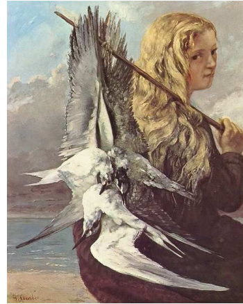
Imagen de Gustave Courbet

—¡Gaviota fuiste, Gaviota eres, Gaviota serás!"