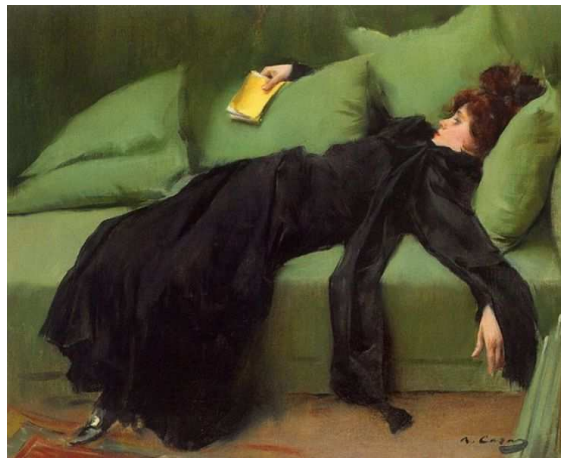
Imagen de Ramon Casas en Wikimedia Commons bajo Dominio público

¿Es posible observar rasgos claramente naturalistas en el fragmento?