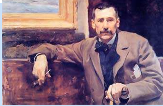
Imagen de Joaquín Sorolla en Wikimedia Commons bajo Dominio público

El propio Galdós establece esta clasificación de su obra: