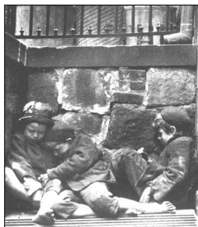
Imagen de Jacob Riis en Wikimedia Commons bajo Dominio público

El cura fue a la mesa y sacó del cajón un bramante, con el que a duras penas logró sujetar las dos remendadas delanteras del chaquetón, de modo que taparan las carnes del muchacho