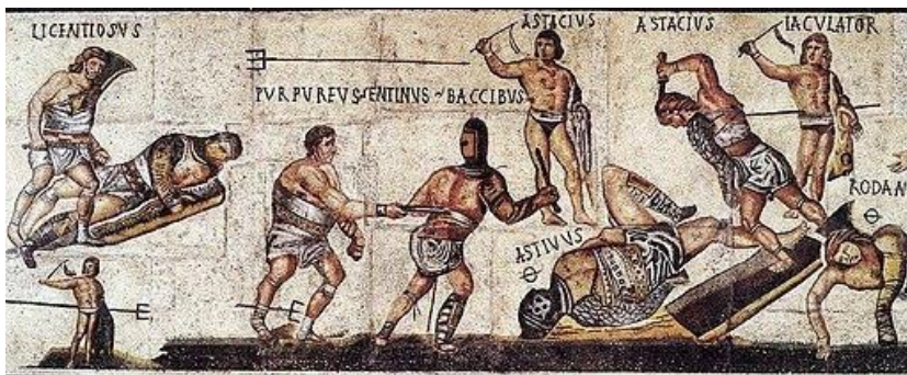
Mosaico de los Gladiadores en Villa Borghese. Imagen en Wikimedia . Dominio público Reconstrucción del Anfiteatro Flavio, Coliseo. Imagen en uso razonable

- arena : terreno en el que se desarrollaba el espectáculo; bajo ella unos pasillos subterráneos y cámaras, fossa , albergaban personas y animales, y almacenaban los materiales destinados a los espectáculos que se subían con mecanismos similares a los montacargas.