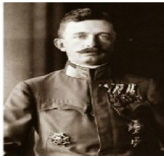
Emperador Carlos I de Austria y IV de Hungría (1916-1918), tras él se disolvió el Imperio