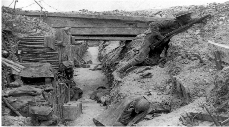
Cheshire Regiment trench Somme 1916

Se calcula que la guerra produjo aproximadamente ocho millones de muertos y seis millones de inválidos.