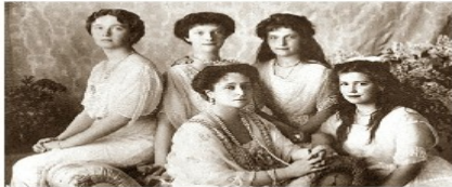
Las Grandes Duquesas, la familia de Nicolás II