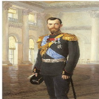
El Zar Nicolás II de Rusia

- Triunfo de la revolución bolchevique en Rusia que se transforma en Unión Soviética .