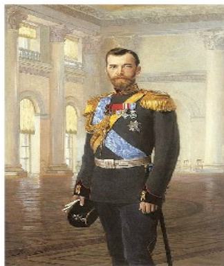
El Zar Nicolás II de Rusia