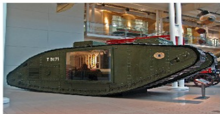
Tanque de la I Guerra Mundial

La contienda generó un intenso desarrollo de los instrumentos y técnicas de guerra : fusiles de repetición, ametralladoras, gases venenosos dando origen a la guerra biológica y química, hubo tanques, dirigibles y aviones, también se practicaron los bombardeos a las ciudades.