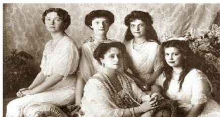
Las Grandes Duquesas, la familia de Nicolás II