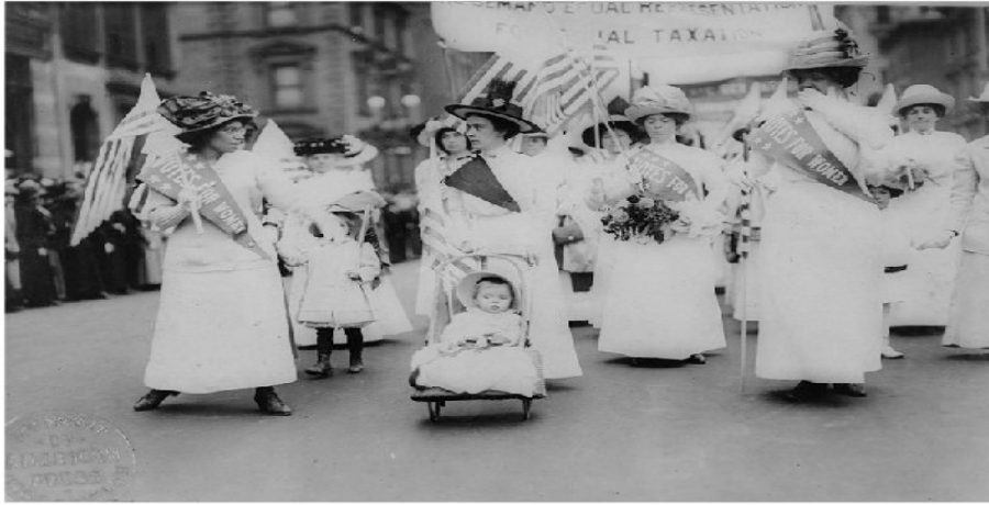
Manifestación de sufragistas en New York (EE.UU.)

Las diferencias sociales se acentuaron con el enriquecimiento de los mercaderes de armas y el empobrecimiento de los pequeños ahorradores , los retirados y los asalariados afectados por la inflación .