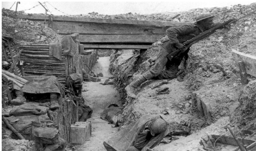
Cheshire Regiment trench Somme 1916