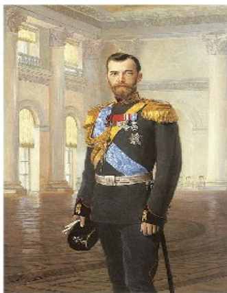
El Zar Nicolás II de Rusia

- Desaparecieron cuatro imperios autoritarios -el alemán, el austrohúngaro, el ruso y el turco- y tres grandes dinastías , los Hohenzollern, los Habsburgo y los Romanov .