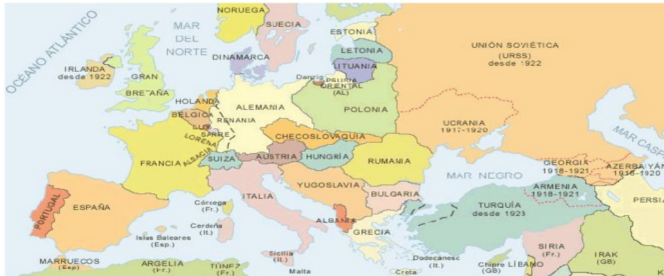
Mapa de Europa tras la paz

Se transformó profundamente el mapa de Europa, rediseñado por el tratado de paz de 1919: