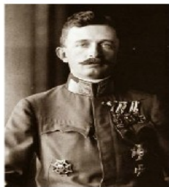
Emperador Carlos I de Austria y IV de Hungría (1916-1918), tras él se disolvió el Imperio