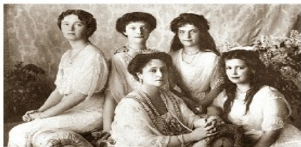
Las Grandes Duquesas, la familia de Nicolás II