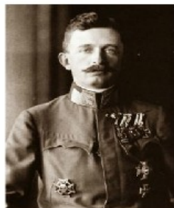
Emperador Carlos I de Austria y IV de Hungría (1916-1918), tras él se disolvió el Imperio