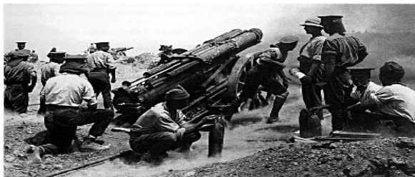
Artillería británica en Galipoli