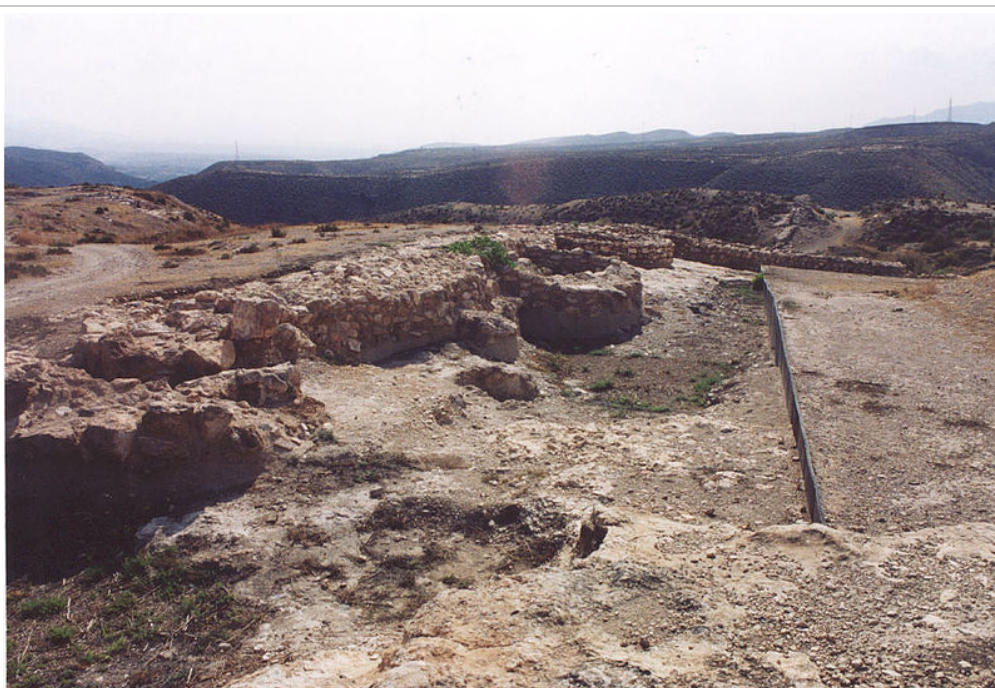
El asentamiento de Los Millares en Almería es uno de los primeros conjuntos urbanos en la península

Pero seguían sin ser verdaderas ciudades en el sentido estricto que nosotros le damos actualmente a esta palabra. Habría que esperar todavía bastante tiempo más. Tuvieron que ser civilizaciones provenientes precisamente del Próximo Oriente, o si lo preferimos, del Mediterráneo Oriental , las que acabaron fundando los primeros núcleos que realmente podríamos considerar como verdaderas ciudades desde los parámetros que actualmente empleamos para definir el hecho urbano.