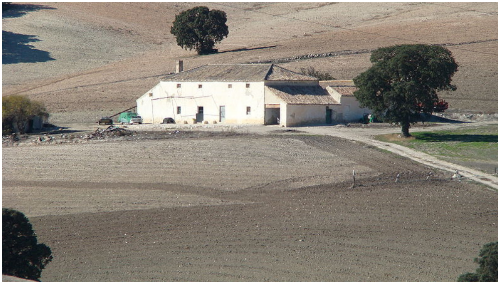
La típica casa del campo andaluz. Cortijo en la localidad granadina de Piñar