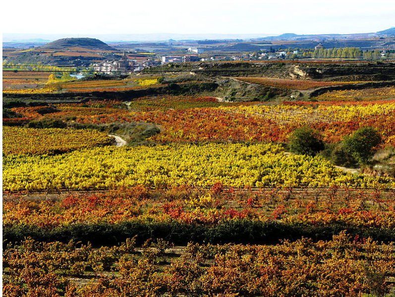
Habitat concentrado entre los viñedos de Briñas en La Rioja

Por su parte, en la España de clima mediterráneo más seco predomina el poblamiento rural concentrado , en forma de pueblos donde se agrupan las viviendas de la población.