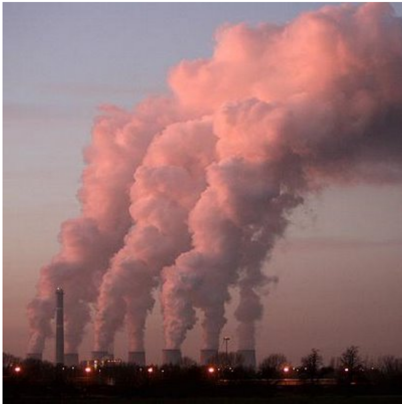
La contaminación de la atmósfera por la emisión de gases sin control, es uno de los principales problemas medioambientales que tienen las ciudades hoy día