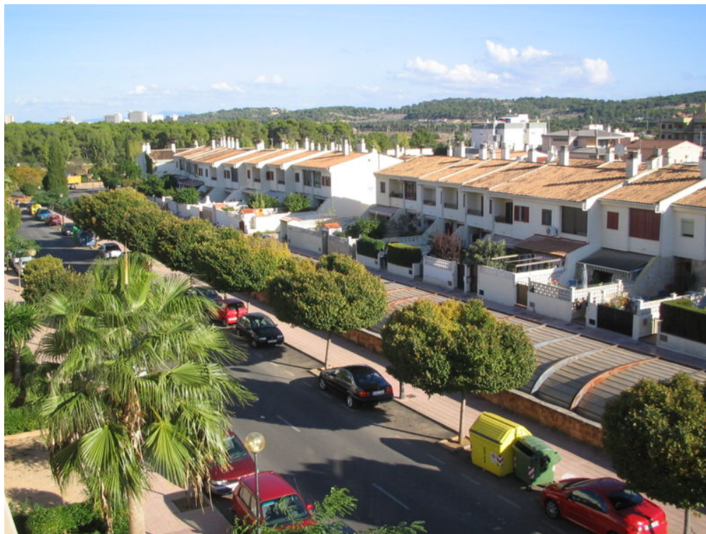
Zona residencial en Son Ferrer en la periferia urbana de Palma de Mallorca

Este proceso de construcción de viviendas dedicadas a un uso vacacional se produjo más temprano en las zonas rurales cercanas a las costas , buscando el turismo de sol y playa. Pero en nuestros días, muchas zonas rurales de interior han sufrido procesos de urbanización semejantes, a veces de dudosa legalidad, cuando no de descarada ilegalidad. Lamentablemente, las instituciones y autoridades que deberían haber velado por la salvaguarda de espacios rurales de alto valor ambiental han actuado en demasiadas ocasiones con absoluta negligencia y dejadez, tal vez no siempre por su ineptitud.