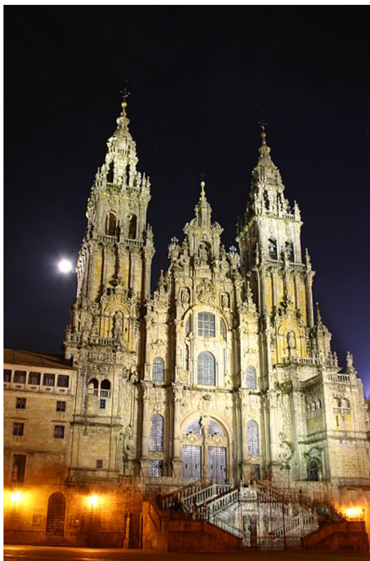
Santiago de Compostela es un buen ejemplo de la importancia de la función religiosa en una ciudad Imagen en Wikipedia de Yearofthedragon bajo CC

menospreciar a la cultural o universitaria y a la comercial o punto central del transporte de mercancías o de pasajeros. Vamos a analizarlas con mayor detalle a continuación.