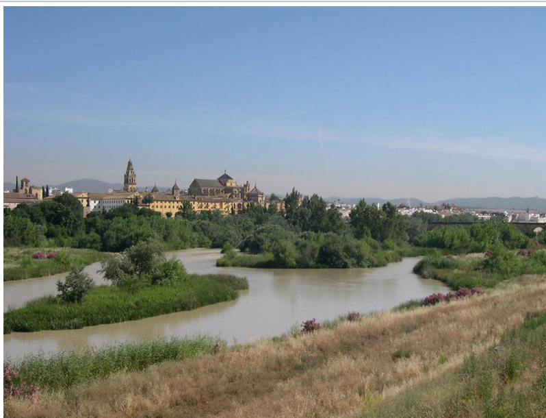
Durante la época del califato, Córdoba fue posiblemente la mayor ciudad del mundo

En 1009 comenzó la crisis en forma de guerra civil . Los contendientes arrasaron la ciudad y saquearon el magnífico complejo palatino de Medina Azahara en las proximidades. Córdoba no se volvería nunca a recuperar totalmente de aquella destrucción, e incluso hoy día, mil años después, su población no es probablemente superior a la que tuvo en época de los califas.