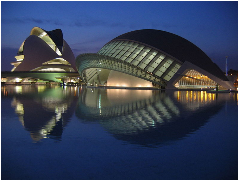
La Ciudad de las Ciencias en Valencia es un buen ejemplo de las formas urbanas más vanguardistas que se llevan a cabo en España