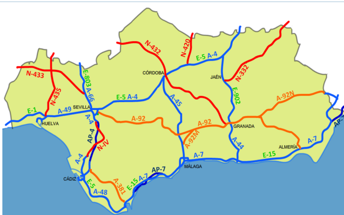
La red viaria de Andalucía muestra la conexión entre las principales ciudades y áreas

Granada, aunque no está situada en la misma línea de costa, forma también parte de este sistema dado su situación peculiar en la zona oriental de la Comunidad y en el interior de los Sistemas Béticos.