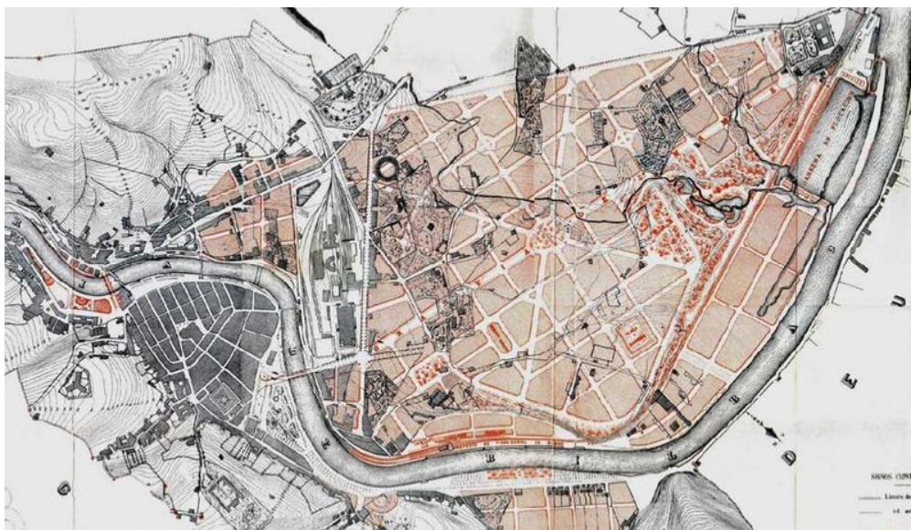
Proyecto de ensanche de Bilbao en 1876

Y de esta forma aparecieron los Ensanches . Es decir, el lugar por el que se podía "ensanchar" la ciudad. Lógicamente este nuevo sector era muy apetecible, ya que se encontraba libre de las calles angostas de los centros históricos, de los ruidos, de los malos olores y de otros problemas propios de ciudades medievales más que de ciudades modernas. Los que más posibilidades económicas tenían, buscaron en estos nuevos lugares un sitio donde vivir mucho más cómodo y espacioso que el que habían tenido sus padres y sus antepasados. La era de la burguesía urbana como clase social predominante en las ciudades había comenzado.