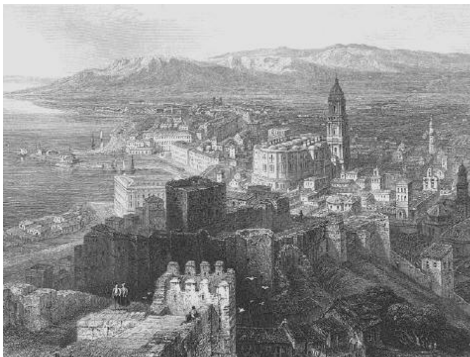
Imagen de la ciudad de Málaga en 1836

3. Desde el punto de vista funcional , una ciudad es un núcleo en el que se concentran y desarrollan actividades de muy distinto tipo y a gran escala. En cualquier caso, lo típico de la ciudad es que entre sus habitantes predominan quienes se dedican a actividades del sector de los servicios ( sector terciario ).