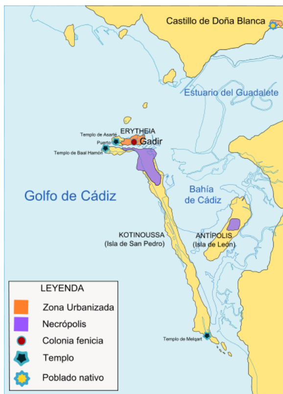
Plano que muestra la situación de la antigua ciudad de Gadir, la actual Cádiz

Durante el siglo XX, las ciudades españolas experimentaron un crecimiento espectacular, en particular en el período que va desde 1950 hasta 1980, aproximadamente. Ya en la década de los años veinte tuvieron un desarrollo importante, pero este se detuvo como consecuencia de los problemas de la década de los años treinta, sobre todo por la Guerra Civil. En la de los cuarenta, los años del hambre fueron también un período de escaso crecimiento del fenómeno urbano. Pero durante los sesenta, este experimentó un gran auge gracias a la inmigración provocada por el éxodo rural . Hoy día la tendencia parece estar invirtiéndose, ya que vivir en el centro de las ciudades es mucho más caro que en la periferia, y los medios de transporte y las comunicaciones son mucho mejores.