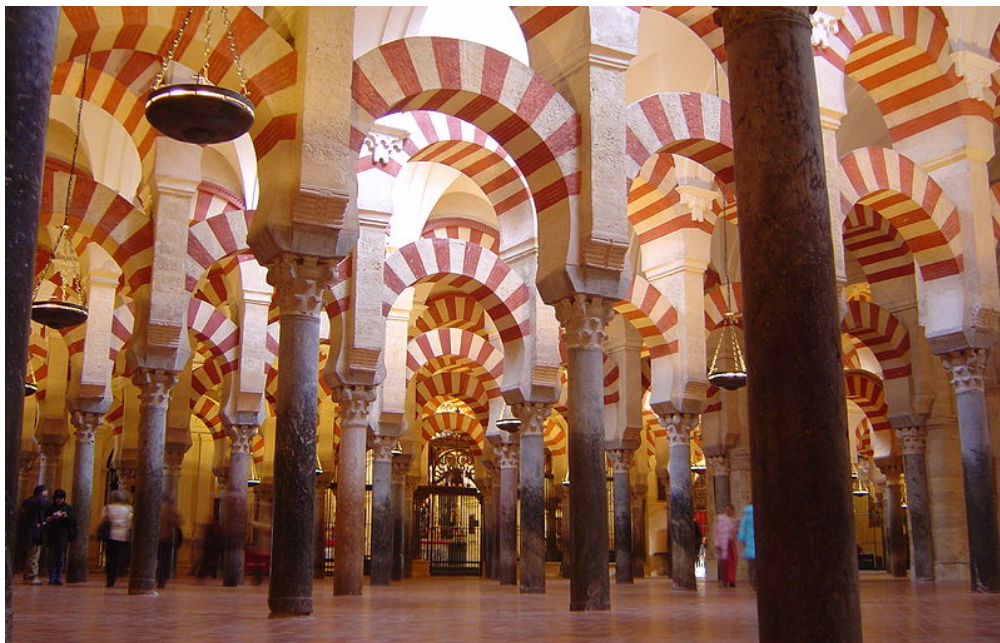
Bosque de columnas en el interior de la mezquita de Córdoba