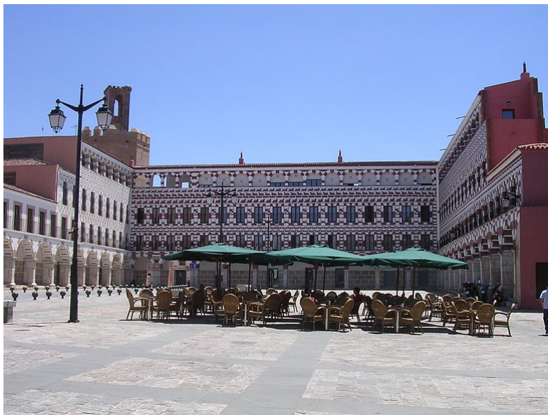
La plaza, como esta en Badajoz, es uno de los principales elementos que constituyen el plano urbano