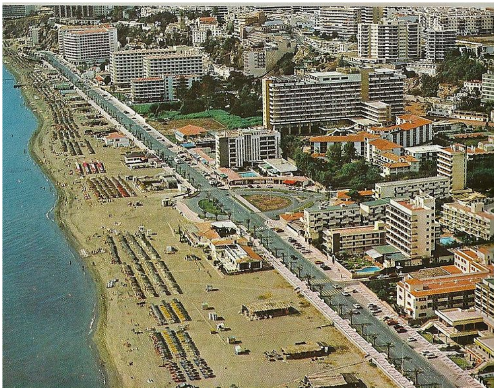
Torremolinos, en Málaga, es un ejemplo en el que la función turística predomina sobre cualquier otra

Todas las ciudades de España tienen en mayor o menor medida una función predominante. Analiza aquella en la que vives y piensa cuál puede ser, en este caso, su función principal. Describe en qué argumentos te basas para tomar esa decisión y pon algún ejemplo concreto, que explique el por qué esa es, en tu opinión, la función dominante del lugar en el que vives.