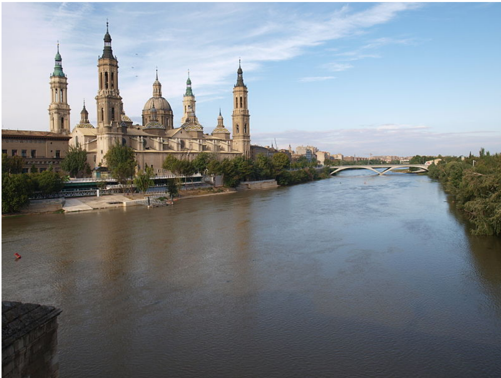
Zaragoza, una de las cinco ciudades más importantes que hay en España

Las cuatro curiosidades que adjuntamos atañen a aspectos urbanísticos muy distintos. En el primer caso se presenta un breve texto sobre Córdoba, que hace mil años fue probablemente la ciudad más poblada que existía en el mundo. En segundo lugar se pasa a analizar una característica típica en la morfología urbana propia del siglo XIX, los denominados ensanches , que permitieron un crecimiento más racional del espacio urbano durante la época de la industrialización. La tercera curiosidad hace referencia a las aportaciones que diferentes urbanistas españoles han hecho tanto al estudio como a la mejora de las condiciones urbanas a lo largo de la Historia. Por último, se ha incluido un ejemplo concreto sobre el caso andaluz, en el que se estudia cómo es la estructura del denominado subsistema urbano andaluz .