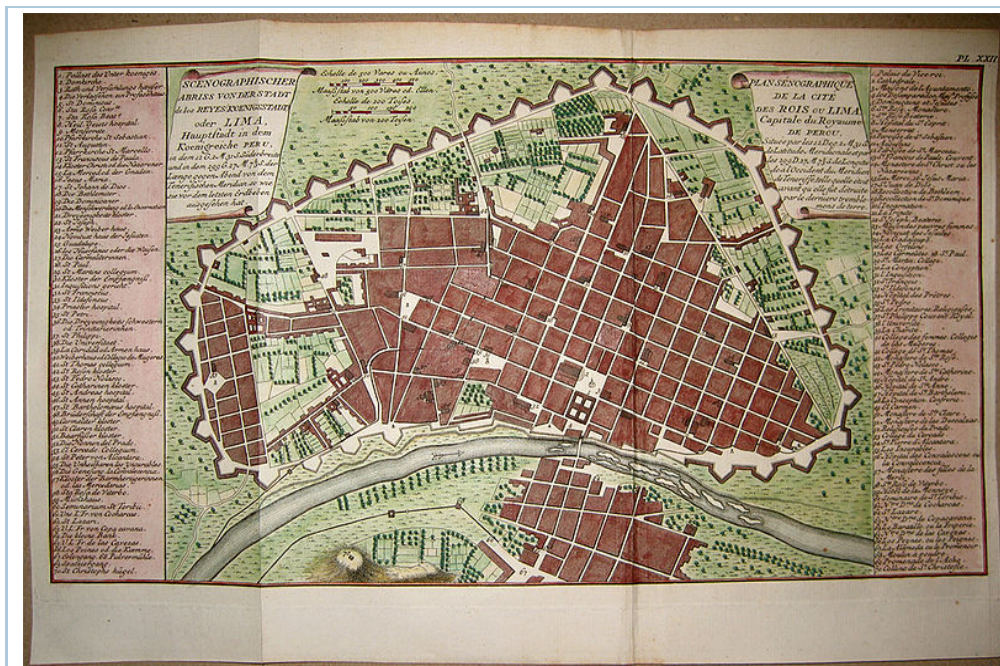
Plano de Lima (Perú), fundada en el siglo XVI, muestra claramente su trazado ortogonal

En el último siglo, sin embargo, no han existido grandes propuestas teóricas desde el ámbito hispano que merezcan ser consideradas como hitos importantes en el proceso de creación del hecho urbano.