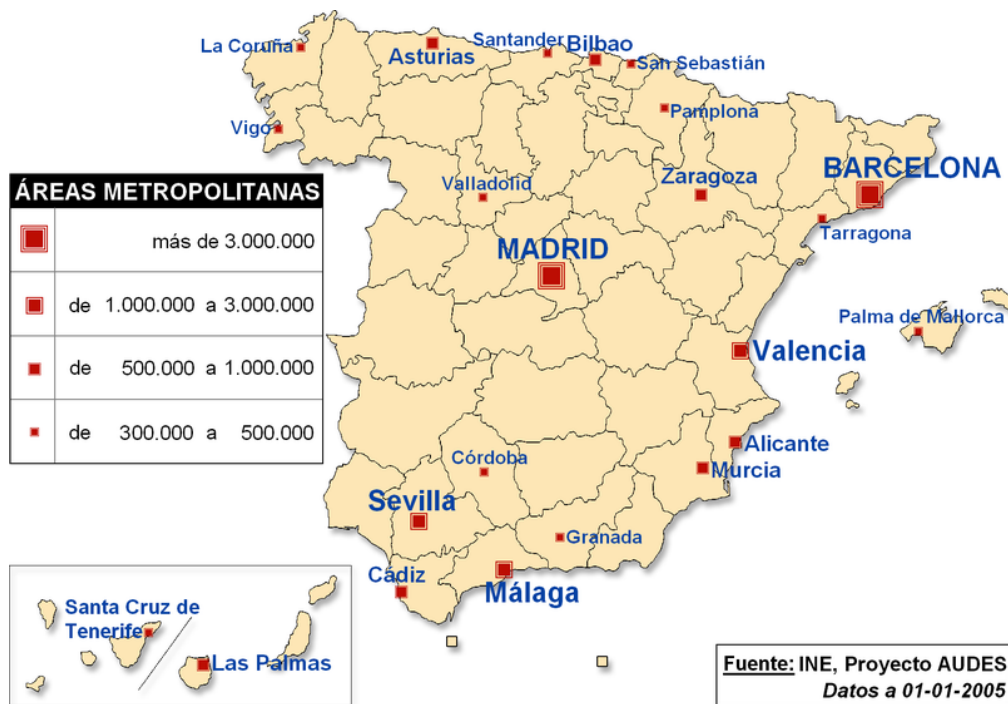
Principales áreas metropolitanas en España