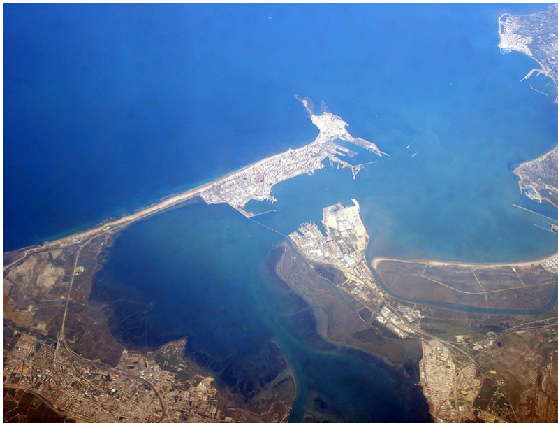
Vista aérea del área metropolitana de la bahía de Cádiz

Las tres primeras áreas metropolitanas que hubo en España fueron las de Madrid, Barcelona y Bilbao. En un segundo nivel en cuanto a su población e importancia económica se encuentran en la actualidad las de Valencia, Sevilla, Málaga y Zaragoza.