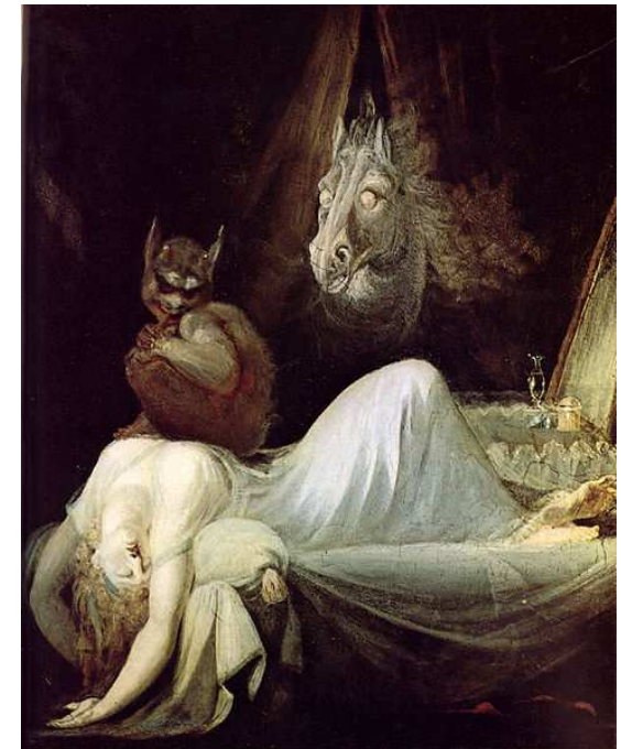
Imagen 1. Autor: Johann Heinrich Füssli Licencia: Dominio público