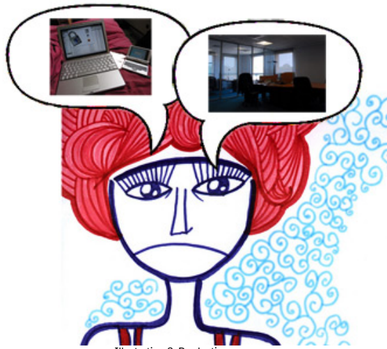
Illustration 3. Production propre