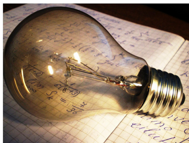
Imagen Idea Bulb con licencia Creative Commons

En un texto escrito, el autor quiere transmitirnos una serie de ideas. Nuestra actividad ante el texto consiste en interpretarlas. Para localizar la idea principal es útil preguntarse, ¿de qué se trata? o ¿qué idea quiere transmitirme el autor?