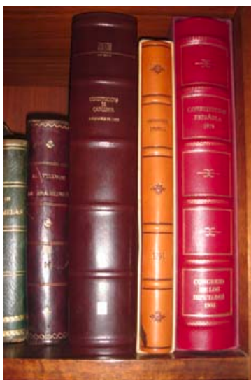
Fotografía Libros, constituciones bajo licencia Creative Commons

A continuación, te proponemos un texto para que lo lees detenidamente. A partir de él, te ofrecemos tres posibles resúmenes. ¿Cuál crees que podría ser el más acertado teniendo en cuenta las expresiones en rojo que se corresponden con el subrayado? Éste es el texto: