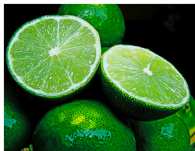
Imagen limón bajo licencia Creative Common