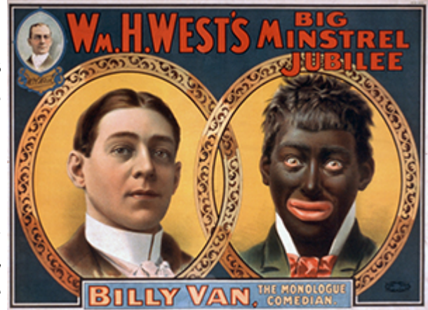
Imagen de Strobridge & Co. Lith en wikipedia licencia CC

se defiende la validez y la riqueza de todo sistema cultural, por diversos que los modelos sean entre sí. Otras posiciones como el interculturalismo parte del reconocimiento de la diversidad y el respeto de la misma, propone el diálogo cultural y el reconocimiento de valores universales compartidos.