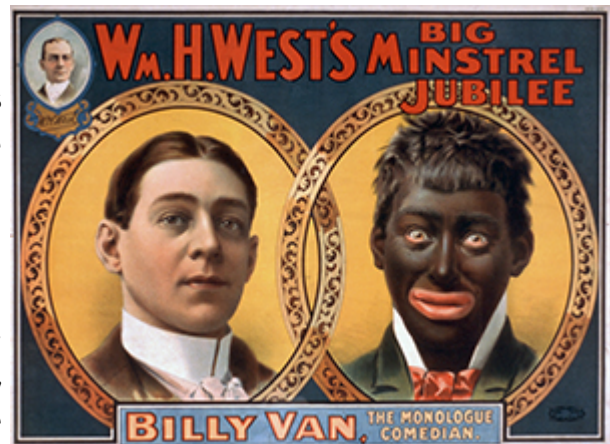
Imagen de Strobridge & Co. Lith en wikipedia licencia CC

se defiende la validez y la riqueza de todo sistema cultural, por diversos que los modelos sean entre sí. Otras posiciones como el interculturalismo parte del reconocimiento de la diversidad y el respeto de la misma, proponiendo el diálogo cultural y el reconocimiento de valores universales compartidos.