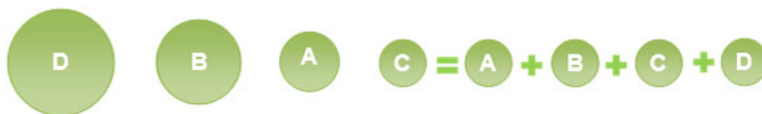
Figura 3. Modelo de estrategia en la práctica analítica pura. Imagen de elaboración propia