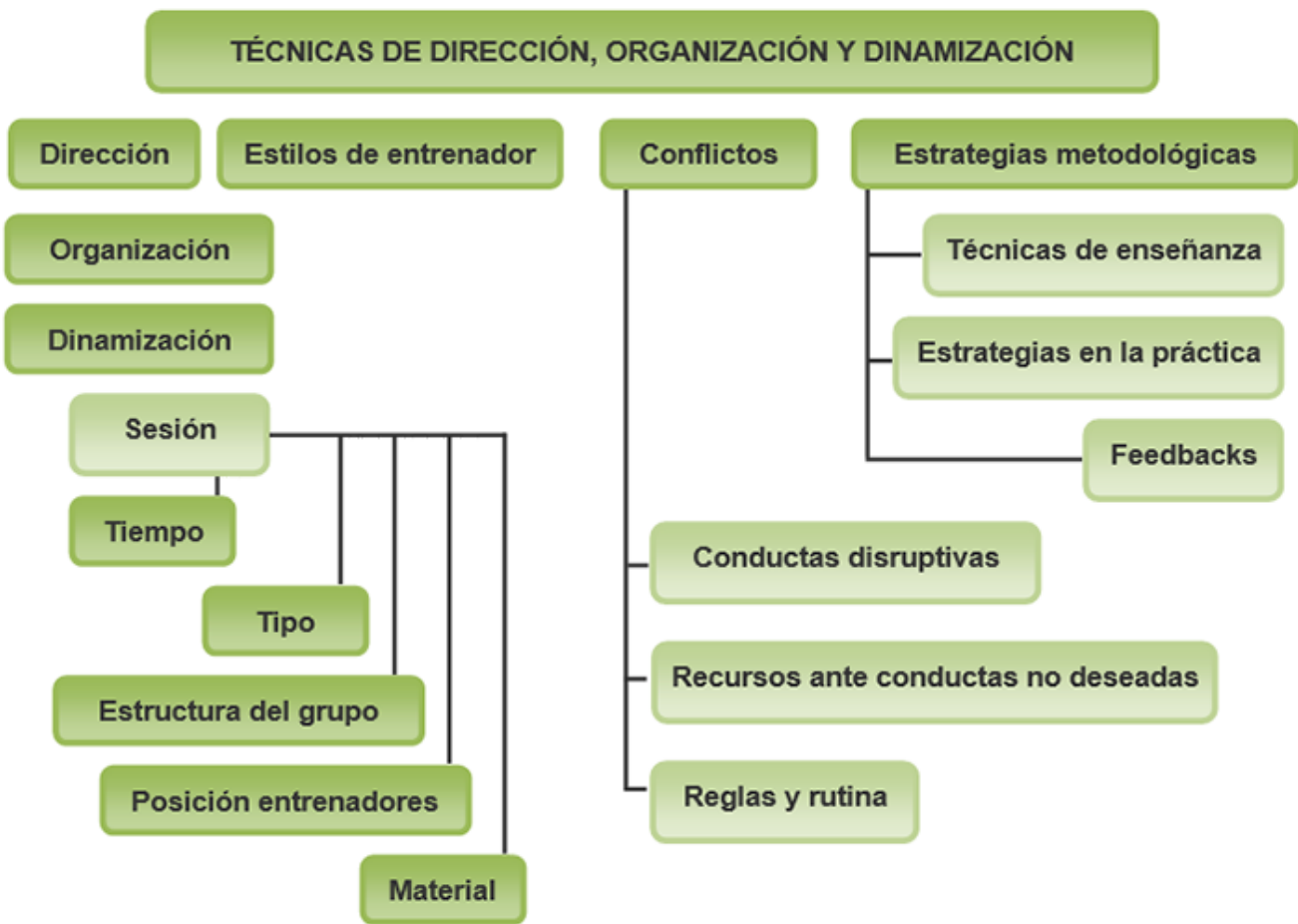
Mapa conceptual Imagen de elaboración propia

En este capítulo se pretende explicar la importancia de la organización, dirección y dinamización de la sesión de entrenamiento y se informará de los diferentes estilos de dirección que un técnico deportivo puede adoptar. Dentro de la organización de la sesión se recalcará la importancia de gestionar adecuadamente el tiempo de práctica, el espacio donde desarrollar el entrenamiento, la posición a adoptar por los técnicos y la estructura del grupo. En cuanto a la forma de presentar las actividades, se incidirá en la importancia de la información inicial y el conocimiento de los resultados. Por último, el tema concluye con una visión sobre los comportamientos de los deportistas y la importancia de establecer reglas y rutinas durante la realización de las actividades, así como de la utilización de los materiales para construir contextos de aprendizaje-entrenamiento.