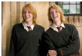
Imagen en flickr.com de Weasleys Wizard Wheezes con licencia Creative Commons

Ya sabes qué es un superlativo. Por si acaso no te acuerdas muy bien, te vamos a poner un ejemplo. Mira.