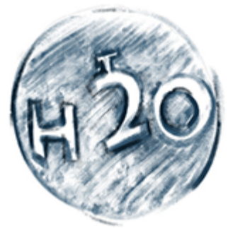
Agua, un recurso esencial.

El agua es considerada un recurso esencial para nuestra existencia, pero es un bien escaso que tiene una incidencia directa en el bienestar de la sociedad. El agua tiene una repercusión en la producción de los alimentos, en la salud, y también en la estabilidad política y social. En este contexto, es lógico que el mundo del deporte colabore de una manera activa intentando contribuir a un uso racional.