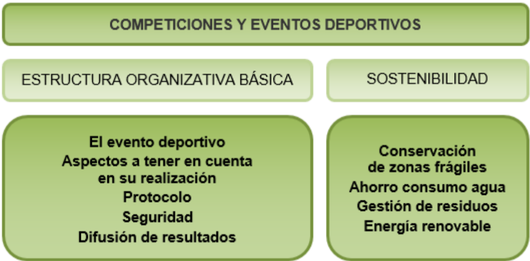
Mapa conceptual Imagen de elaboración propia

En este tema trataremos el proceso de organización y gestión de competiciones y eventos deportivos, centrándonos en los requisitos administrativos y los medios materiales y humanos necesarios. Por otro lado, se tratarán aspectos sobre la sostenibilidad en el desarrollo de los eventos deportivos y las competiciones.