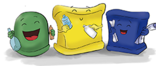
Gestión de residuos y limpieza. Imagen de elaboración propia

La cuestión principal en relación con la gestión de residuos es cómo controlar el flujo de desechos en la sede donde se desarrolla el evento deportivo , ya que nadie es ajeno a la cantidad de residuos que generan dichos eventos. Por ejemplo, durante el Máster de Tenis de la Comunidad de Madrid (2008) se reciclaron 20 000 kilos de envases ligeros.