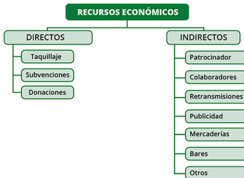
Figura 1. Vías de apoyo económico. Imagen de elaboración propia