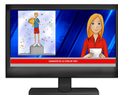
Difusión de los resultados.