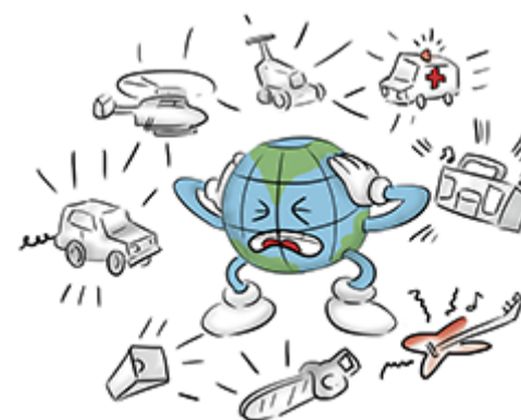
Impactos ambientales. Imagen de elaboración propia

En las competencias y eventos deportivos que se realizan en el medio natural hay que extremar las precauciones. La responsabilidad de salvaguardar el medio natural corresponde tanto a los organizadores como a los participantes y al público. Una mala planificación e inadecuada gestión puede ocasionar impactos ambientales sobre el terreno o en el agua. Como criterio general se recomienda no organizar eventos en espacios naturales protegidos.