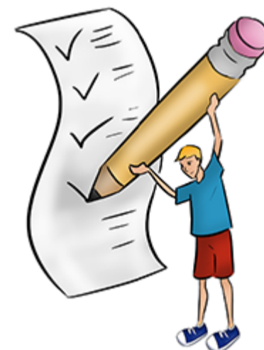
Organización de actos de protocolo. Imagen de elaboración propia

Con el protocolo, la institución encargada de organizar el evento construye las realidades del mismo con un conjunto de normas (ceremonial) establecidas que determinan la forma de ejecutar los actos oficiales y privados con solemnidad.