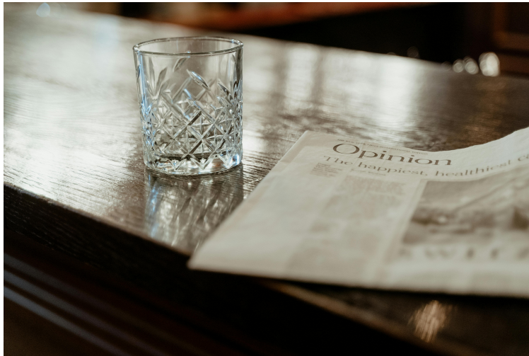
Imagen de Mart Production en Pexels < https://www.pexels.com/es-es/@mart-production/ > . Sin título < https://www.pexels.com/es-es/foto/barra-bar-beber-bebida-9566374/ > (Licencia Pexels < https://www.pexels.com/es-es/license/ > )

En la situación de aprendizaje de este reto has estudiado más a fondo los tipos de textos que existen. Como sabes, según el canal, los textos pueden ser orales o escritos, mientras que según su estructura, podemos encontrar diferentes tipos como narrativos, descriptivos, argumentativos, etc. Ahora es el momento de que pongas en práctica todo lo aprendido para que elabores correctamente tu propio artículo de opinión, es decir, un texto argumentativo escrito. Para ello, te planteamos el siguiente reto: