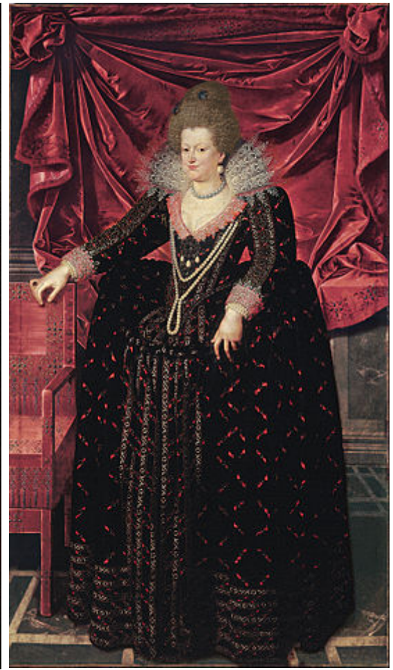
Pourbus, María de Médici, 1606