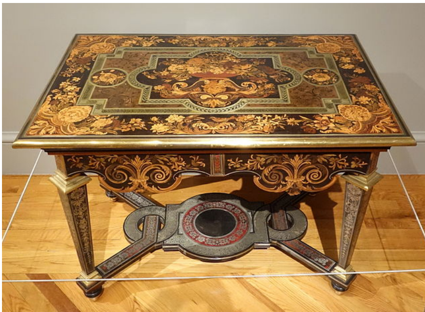
Mesa de marquetería de Boulle

consiste la aplicación de láminas metálicas de estaño y cobre sobre materiales orgánicos como el marfil, las escamas de tortuga o el carey.