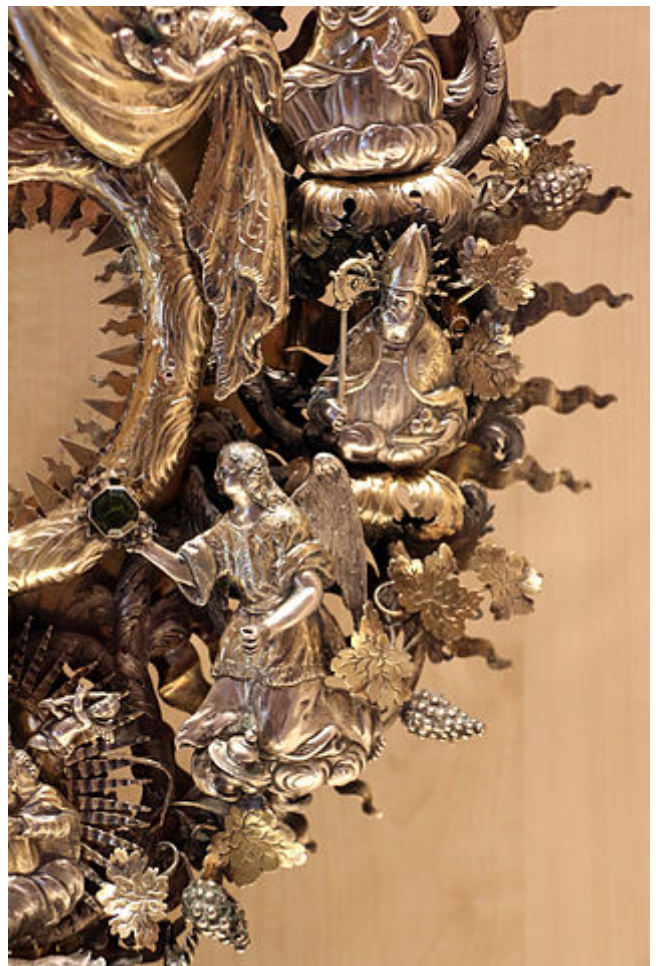
Detalle de una custodia barroca en plata dorada