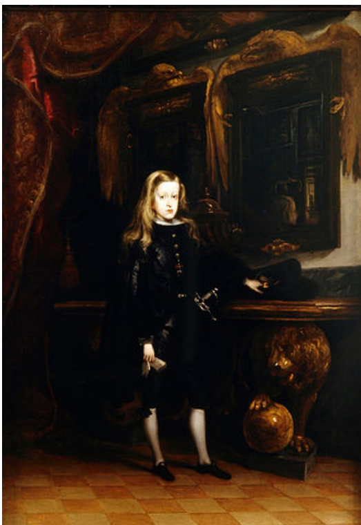
Carreño de Miranda, Carlos II, 1671

Lamentablemente en España se perdió el mayor conjunto palaciego de la monarquía española de los Austrias con el incendio que sufrió el Alcázar de Madrid en 1734 . Fueron pasto de las llamas las mejores piezas de mobiliario y decoración del Barroco, y sobre los restos del antiguo Alcázar se construyó el actual Palacio Real.