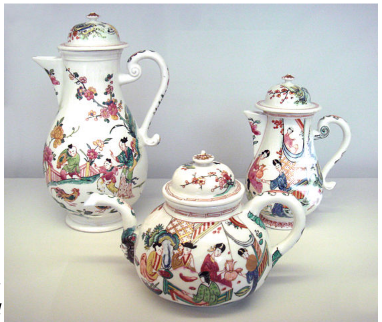
Porcelana de Chinería de Meissen

Durante siglos, la porcelana fue un artículo de lujo de exclusiva fabricación oriental con China y Japón como únicos productores. Pues bien, durante el Barroco, y tras siglos de experimentación por parte de los más reputados alquimistas por fin se consigue fabricar porcelana en Europa, siendo la porcelana de Meissen , en Alemania, el primer centro productor. Se funda la Real Fábrica Sajona de Porcelana , con sede en Meissen, cerca de Dresde, financiada por los reyes germánicos y que también guardaban celosamente tanto la receta como la marca,