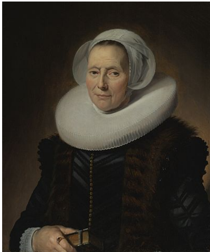
Retrato de dama con cuello de lechuguilla de Frans Hals

La moda barroca reflejará a la perfección la idea de poder y estatus social que defenderán tanto la iglesia contra reformista como las monarquías absolutas. Se distinguen tres periodos coincidiendo con los reinados de los tres principales monarcas franceses. La moda Enrique IV se caracterizará por ese llamativo cuello gorguera con forma como de gran abanico llamado de lechuguilla y en el caso de las mujeres la gorguera se alzarán conformando el llamado cuello Médici . Los hombres usarán sombreros de ala ancha y las mujeres escotes rectangulares.