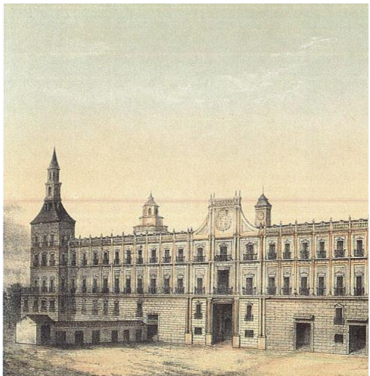
Real Alcázar de Madrid, 1710