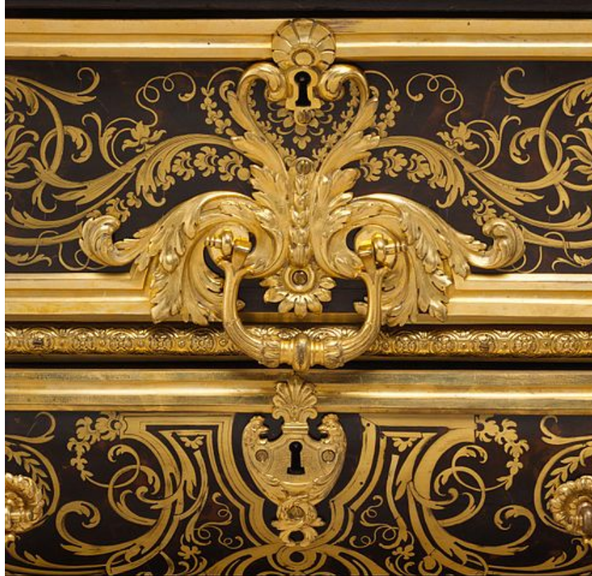
Detalle de una cómoda realizada por Boullé

fantásticas y pintorescas y las elaboradas marqueterías remachadas con láminas de oro y plata. Las sillas adquieren un enorme respaldo y se tapizan al igual que los sofás y divanes, y el cabinet es el mueble estrella, que compartirá protagonismo con los enormes espejos venecianos . El estilo Luis XIV marcará la tendencia para el resto de cortes europeas, con muebles de enormes dimensiones, diseños simétricos y mucho oro que estableció el decorador y ebanista André Charles Boullé .