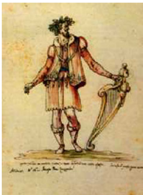
El compositor Jacobo Peri

El nacimiento de la ópera se sitúa en el último tercio del siglo XVI en la Camerata Fiorentina , constituida por una serie de intelectuales, humanistas y músicos florentinos que se reunían en casa del conde de Bardi, entre los que estaba Vincenzo Galilei, el padre del famoso astrónomo Galileo Gallilei. Entre otras cosas, este grupo de humanistas revolucionó la forma de entender la música, que para ellos se había corrompido con el paso del tiempo, y había pues que volver a las formas musicales de la antigüedad clásica. Según sus estudios y averiguaciones, las grandes tragedias clásicas tenían fragmentos que se cantaban, y se propusieron recuperar lo que para ellos debió ser la música de la antigüedad. Crearon las monodias , sencillas composiciones cantadas con melodías sobre unos sencillos acordes sostenidas por el bajo continuo. Siguiendo con estos experimentos, en 1598 el compositor Jacobo Peri estrenó su monodia Eurídice , en donde se cantaba un drama en este estilo monódico, constituyendo la génesis de lo que será la ópera y la antesala de la primera ópera de la historia, el Orfeo de Monteverdi, estrenada en 1607.