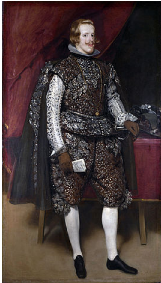
Velázquez, Felipe IV de castaño y plata, 1632