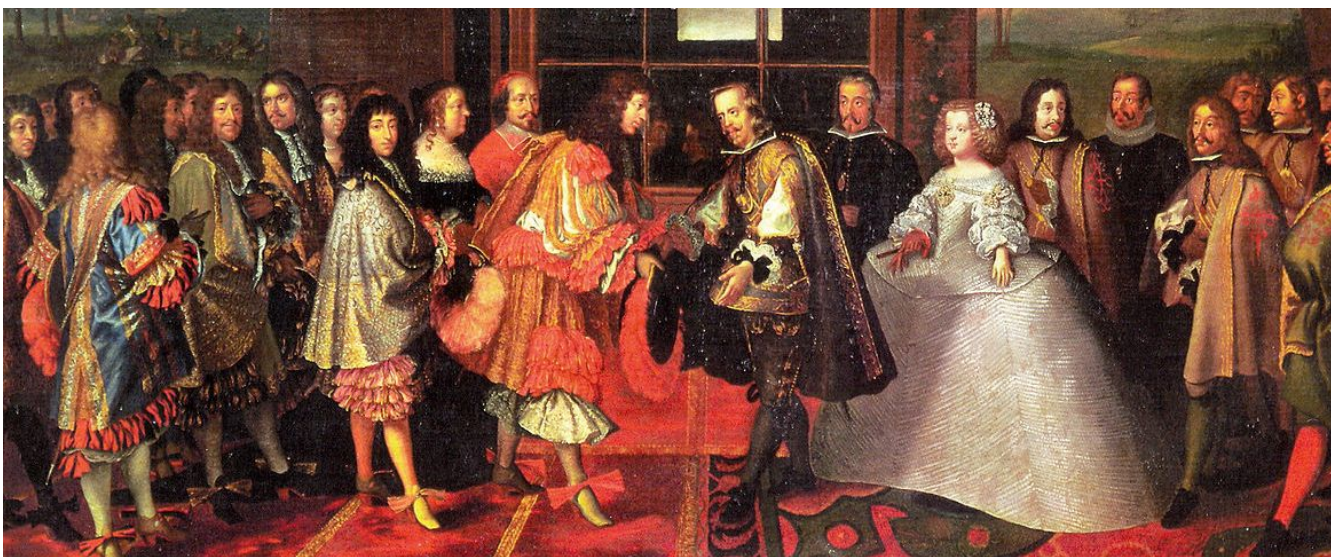
Laumosnier, Luis XIV y Felipe IV en la Isla de los faisanes, 1659, detalle

Las enormes pelucas rizadas serán las protagonistas del atuendo masculino, cuya máxima aportación en esta época será el traje de tres prendas , antecesor del traje de chaqueta actual, formado por calzón hasta las rodillas, la chaqueta antecesora del chaleco y la casaca . Se completa el atuendo masculino con sombreros de copa baja, zapatos con profusión de lazos y hebillas, y volados de encaje y cintas que decoran la totalidad de prendas.