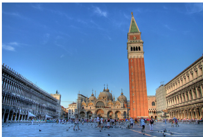
Plaza de San Marcos, Venecia