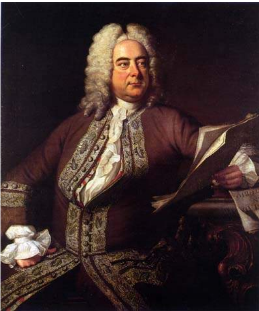
Hudson, Retrato de Händel, 1741