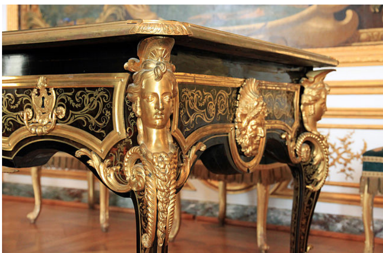
Mesa denominada bureau

De entre todos los muebles, serán los franceses los mejor elaborados y los que resulten más elegantes, y al igual que con la ropa, será la corte real de Versalles la que marque las tendencias en cuanto al diseño mobiliario, desbancando otra vez a Italia y su hegemonía en este campo que había disfrutado durante el Renacimiento.