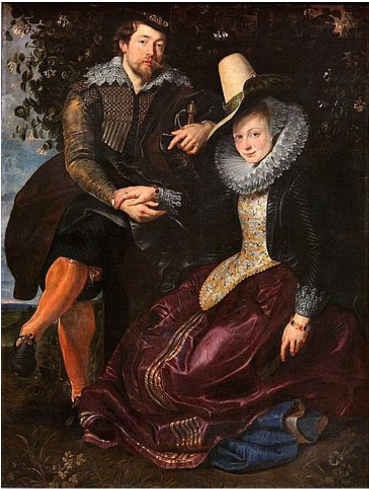
Rubens, Autorretrato con su esposa, 1609