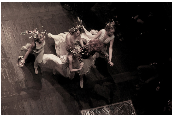
Representación del Orfeo de Monteverdi

Nace la ópera o teatro musical gracias a las aportaciones de la Camerata florentina , en especial de Jacobo Peri que en su Eurídice introduce el estilo recitativo y las monodias que serán la antesala de las arias. La primera ópera fue el Orfeo de Monteverdi , estrenada en 1607. Los elementos de la ópera son las aberturas o partes instrumentales introductorias, los recitativos o partes cantadas donde sobresaldrán las arias , los coros y los interludios o pequeñas piezas instrumentales entre acto y acto. Para crear una ópera hacen falta un libretista que se encarga del texto y un músico que componga la música, además de un sinfín de especialistas técnicos y artísticos para realizar los decorados o atrezzos , vestuarios, maquillaje y ambientación de la ópera.