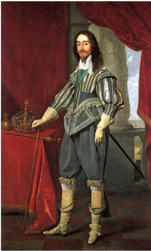
Mijtens, Carlos I de Inglaterra en 1631