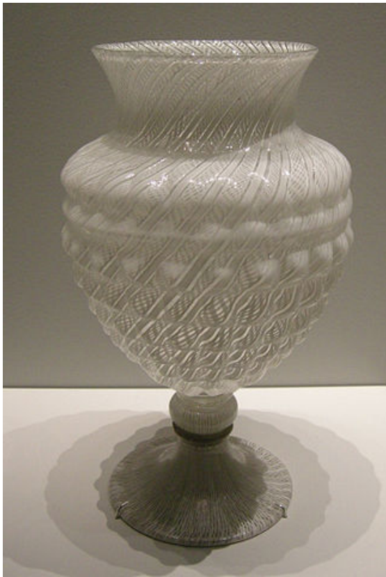
Vaso de cristal de Murano