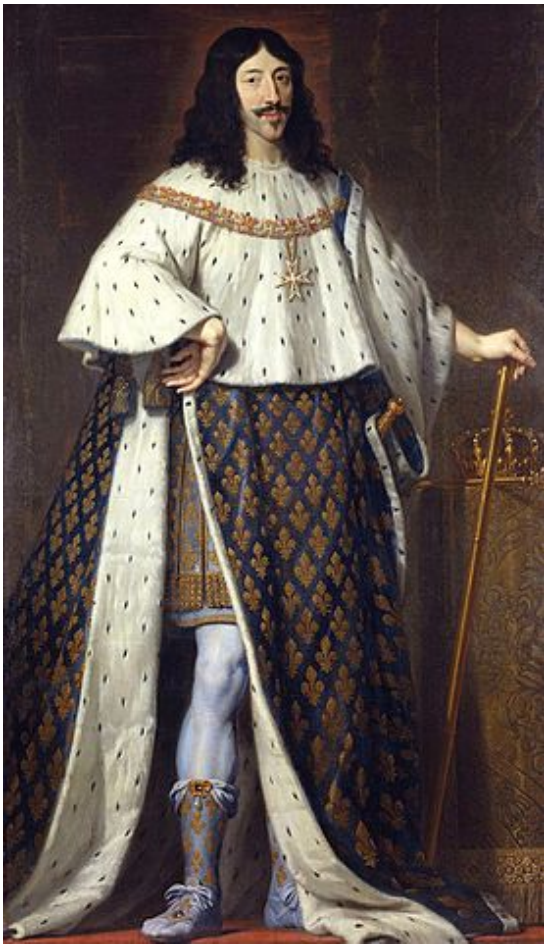
Philippe de Champaigne, Luis XIII, 1639