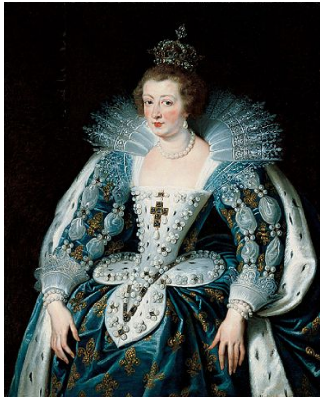
Rubens, Ana de Austria en 1625