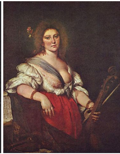
Posible retrato de Bárbara Strozzi hacia 1630