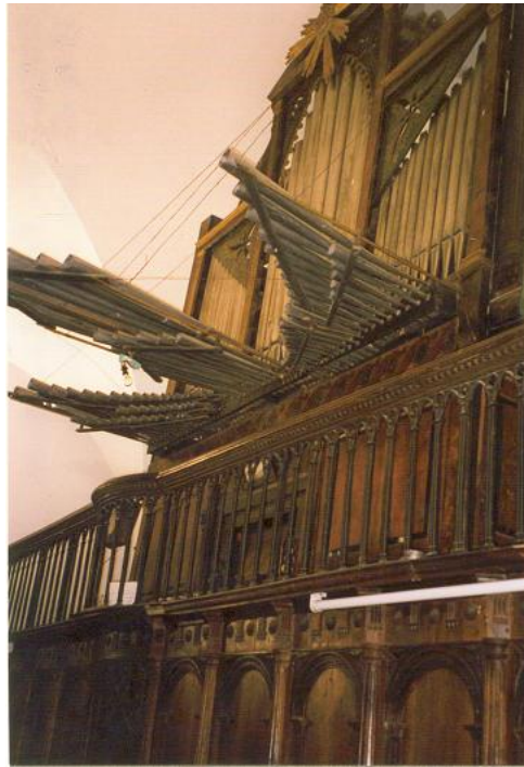
Órgano con trompetería de batalla