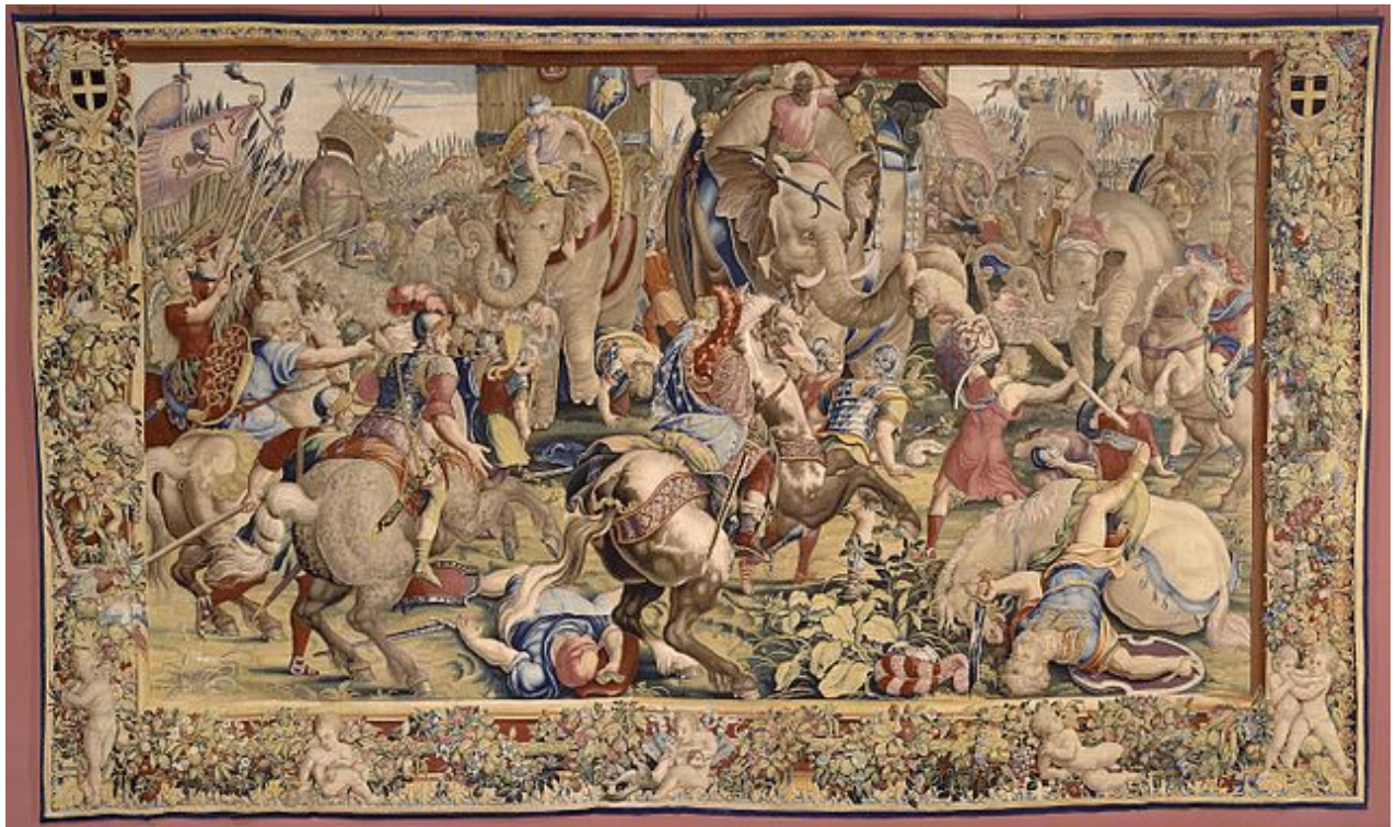
Tapiz gobelino de La batalla de Zama, 1690