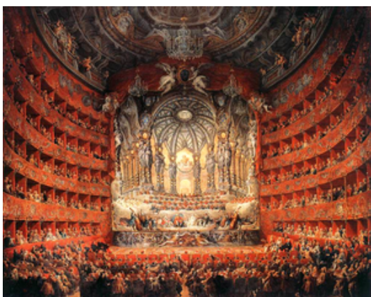
Representación de una ópera francesa

Antonio Vivaldi fue una de las figuras más importantes de la música, con una extensa producción que abarca desde óperas a conciertos y que comenzó en su Venecia natal para expandirse por todo el mundo e influenciar notablemente al resto de compositores, como Bach. Su máxima aportación a la música fue el establecimiento de la estructura formal y rítmica de los conciertos para orquesta , que rebosan vitalidad, entusiasmo y melodías innovadoras, como su famoso concierto Las cuatro estaciones , compuesto alrededor de 1720 y que ha pasado a la historia como una de las piezas más reconocidas de la música de todos los tiempos.