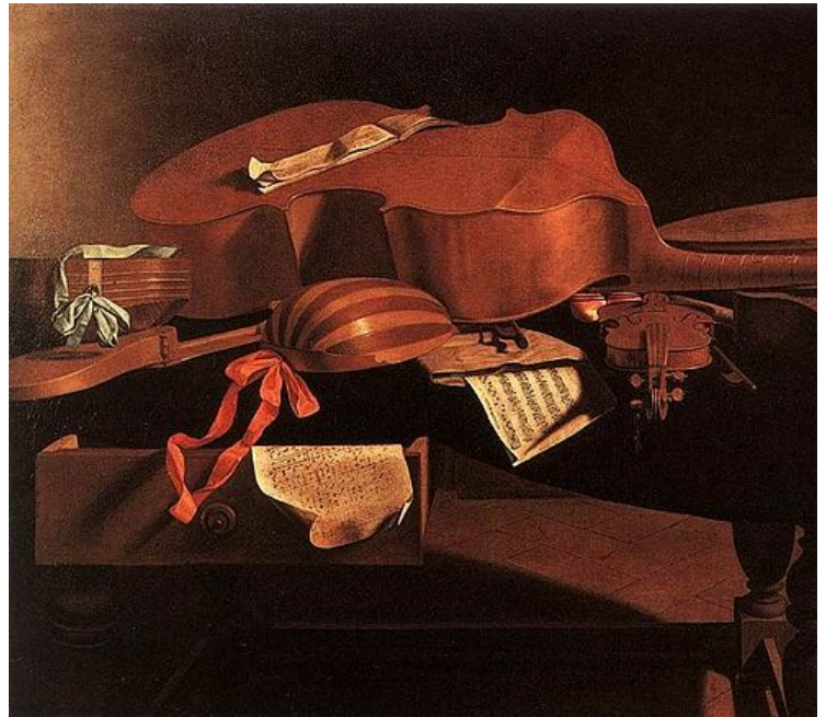
Baschenis, Instrumentos musicales del siglo XVII