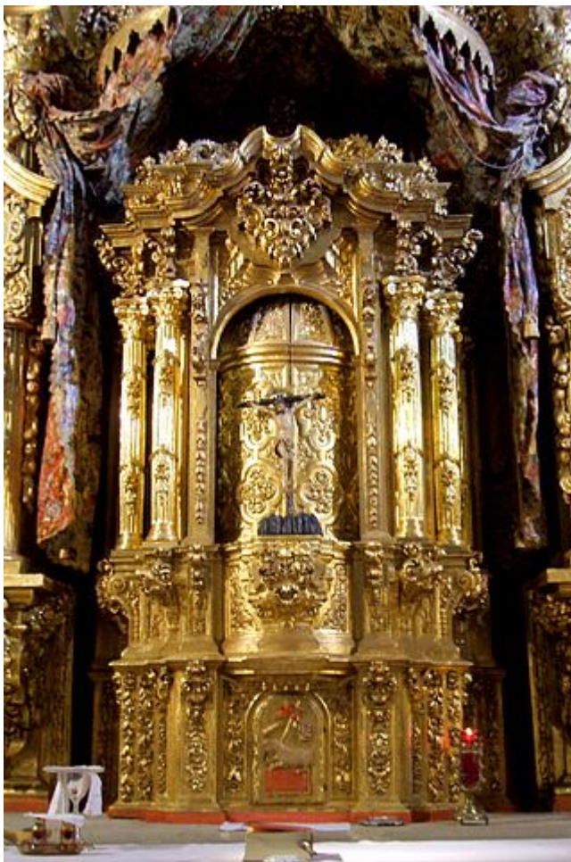
Sagrario del Convento de la Encarnación de Baeza, Jaén