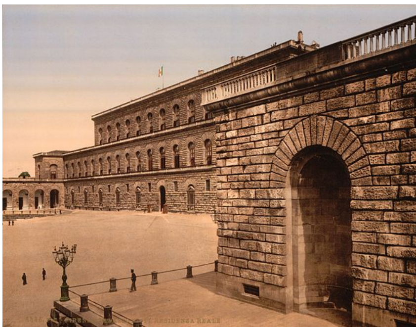
Palacio Pitti hacia 1900, donde se estrenó Eurídice

Imagen de B. Buontalenti en Wikipedia de Dominio público