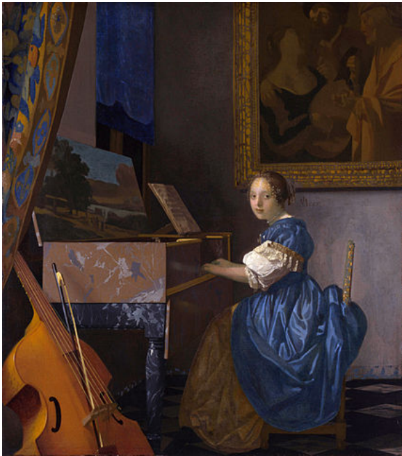
Vermeer, Mujer sentada tocando el virginal , 1672

Italia es el país donde se produce la gran renovación de la música en el barroco, y especialmente en la ciudad de Venecia , cuna de la revolución de la música barroca . En esta época se crean nuevas composiciones musicales tanto para la música profana como dentro de la música religiosa, siendo la basílica de San Marcos el gran epicentro de las nuevas corrientes musicales.