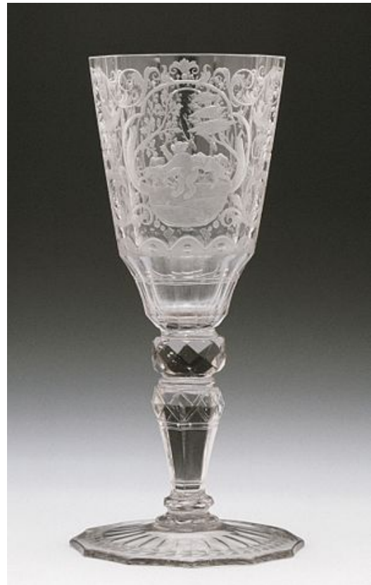
Copa de cristal de Bohemia