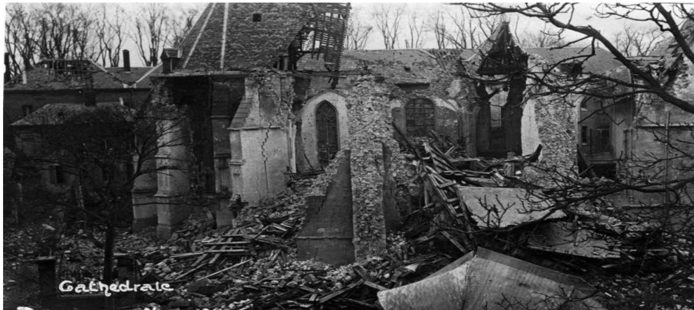
November 1918