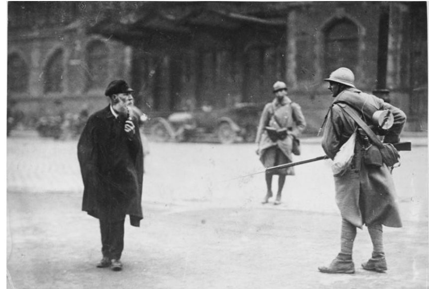
Bundesarchiv - Bild 183-R09876 Foto: o. Ang. | 1923

Soldados franceses y un civil durante la ocupación del Ruhr. http://es.wikipedia.org/wiki/Archivo:Bundesarchiv_Bild_183-R09876,_Ruhrbesetzung.jpg