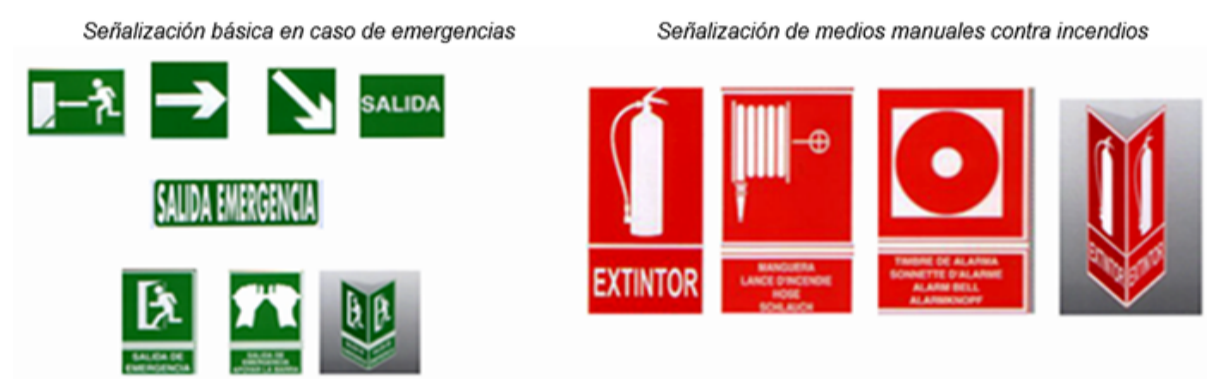
Figura 1. Interpretación y señalización básica en una instalación deportiva.