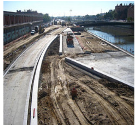
Mercado de la tierra: construcción de carreteras

Como ya sabemos, el factor productivo "Recursos Naturales" abarca una gran cantidad de elementos como la tierra, las semillas, las materias primas o las fuentes de energía. Estos mercados presentan una peculiaridad y es que la oferta de los mismos está condicionada por la cantidad de recurso que se puede encontrar en la naturaleza y por el hecho de que, como ya vimos, dicha cantidad puede renovarse o no. Es más, en el caso de los recursos no renovables su disponibilidad es limitada.