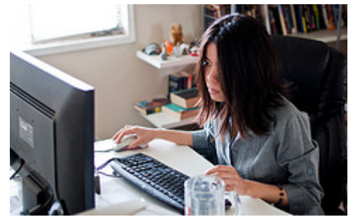
Empleo público

De la misma forma, el Estado regula las formas de contratación (tipos de contrato, duración, extinción de los contratos, etcétera) pero también interviene activando el mercado de trabajo a través del empleo público, de las inversiones públicas, de los incentivos para la contratación, de las ayudas para la creación de empresas o de las prestaciones para desempleados.