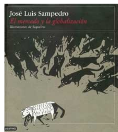
Portada del libro "El mercado y la globalización"

Se suele decir que como demandante de bienes y servicios el consumidor es el que tiene la libertad y el poder de elección en el mercado. No obstante, habría que matizar esta afirmación, ya que aunque sí puede tener un relativo poder individual, en una sociedad de consumo como la actual, su actuación viene condicionada, en primer lugar, por sus ingresos (sólo puede entrar en el mercado si tiene dinero para hacerlo) y en segundo lugar por la influencia que todas las empresas generan