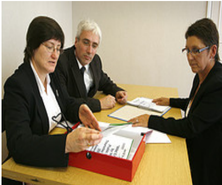
Reclutamiento de personal

Es un mercado de gran importancia porque los ingresos de la mayoría de las personas dependen de la renta obtenida por su trabajo. Su funcionamiento depende de la intervención de todos los agentes económicos: