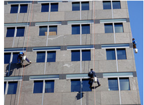
Plus de peligrosidad en su salario

La distribución de la renta analiza la forma de repartir la renta entre los propietarios de los factores productivos: salarios, rentas de la tierra, intereses, alquileres, beneficios y demás tipos de remuneración de los factores. Del análisis de dicha distribución a través de diferentes indicadores se deduce que la desigualdad es su rasgo más característico. A nivel mundial la diferencia de renta entre las personas que más ganan y las que menos es abismal (el 20% de la población posee el 86% de los recursos).