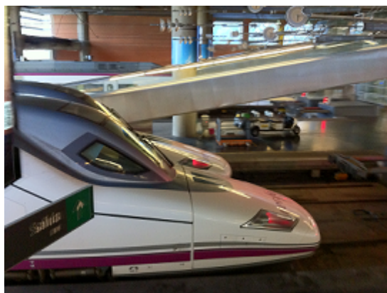
Mercado de capital: bien no corriente