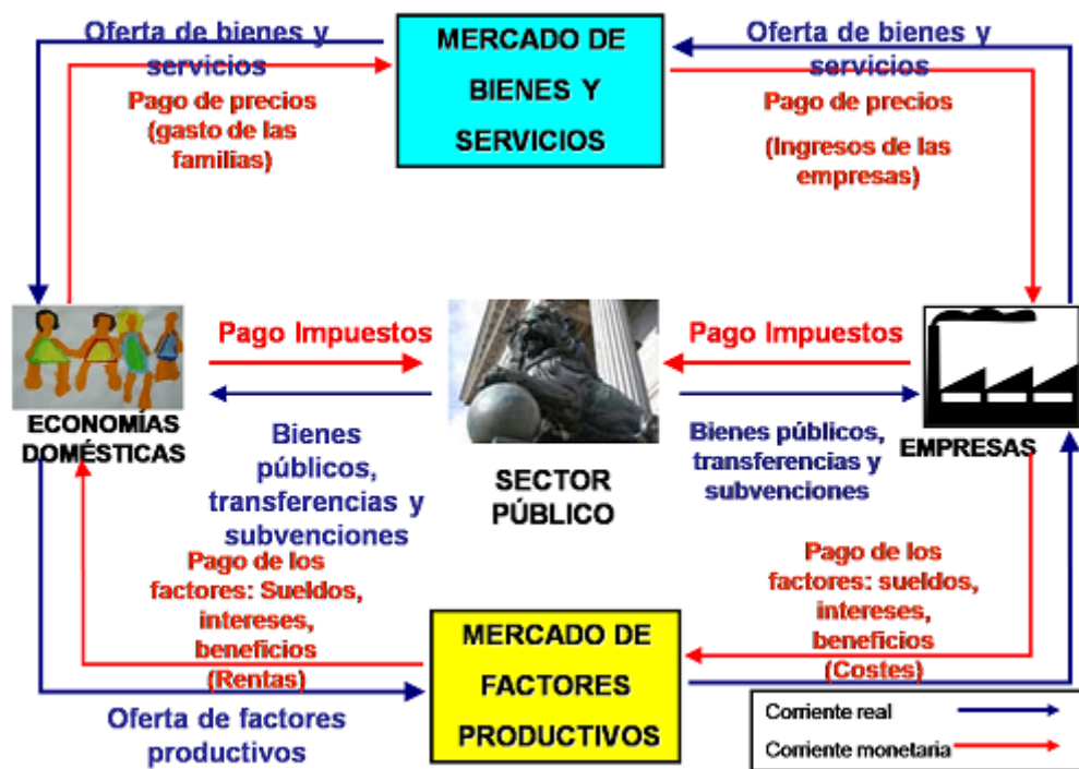
Flujo circular de la renta Esquema de elaboración propia