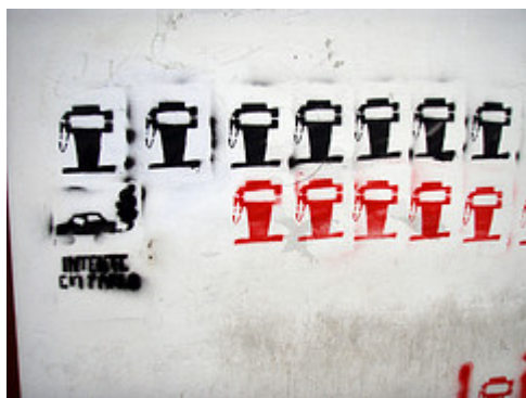
Dependencia del petróleo

Durante la última década, los precios de algunas materias primas alimentarias han pasado por épocas de fuertes ascensos que han llegado a ocasionar graves crisis a nivel mundial, especialmente en los países menos desarrollados, tal como ponen de manifiesto organizaciones internacionales como la FAO (Organización de las Naciones Unidas para la Alimentación y la Agricultura). Puedes completar esta información haciendo click aquí .