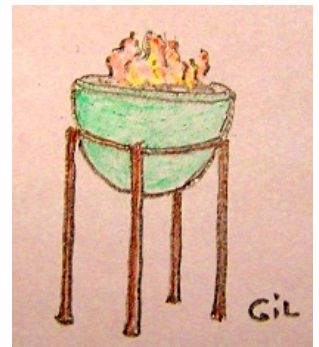
flamma > llama

Recuerda que ya habíamos visto otros orígenes de nuestra -j : cuando iba en posición inicial de palabra seguida de vocal ( iustitia > j usticia) y como resultado del grupo " -li + vocal " ( alium > a jo)