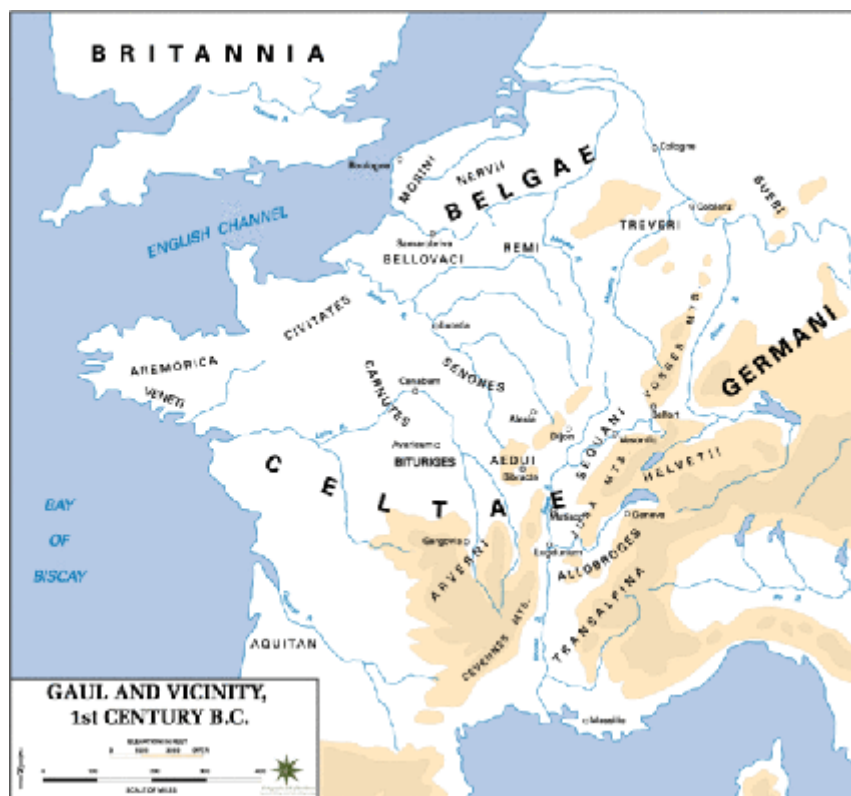
Mapa de las campañas de la guerra de las Galias