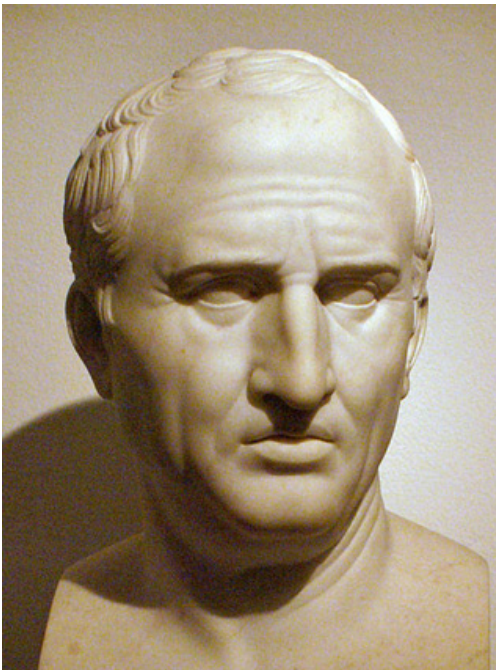
M. Tulio Cicerón

Precisamente durante su consulado, la fuerte inestabilidad y la lucha por el poder desembocaron en un acontecimiento que fue anticipador de la futura dictadura de César: estamos hablando de la conjura de Lucio Sergio Catilina en el 63 a.n.e.