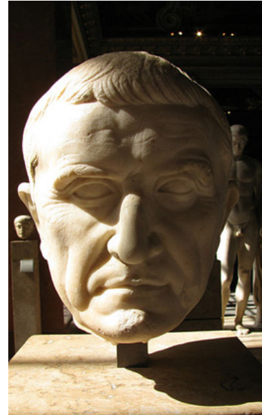
M. Licinio Craso