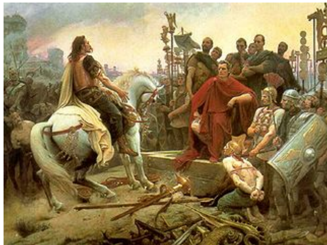
Vercingetórix arroja sus armas a los pies de Julio César por Nioner-Noël Royer.

Imagen en Wikimedia Commons bajo dominio público .