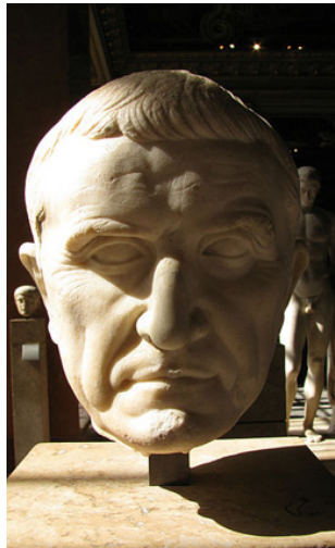
M. Licinio Craso