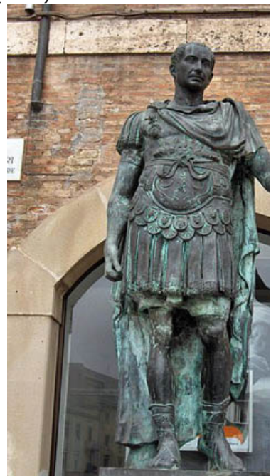
C. Julio César, Rímini Imagen en Wikipedia . Contenit

male (adv): mal post + Ac: después postea (adv.): después sic (adv.): así