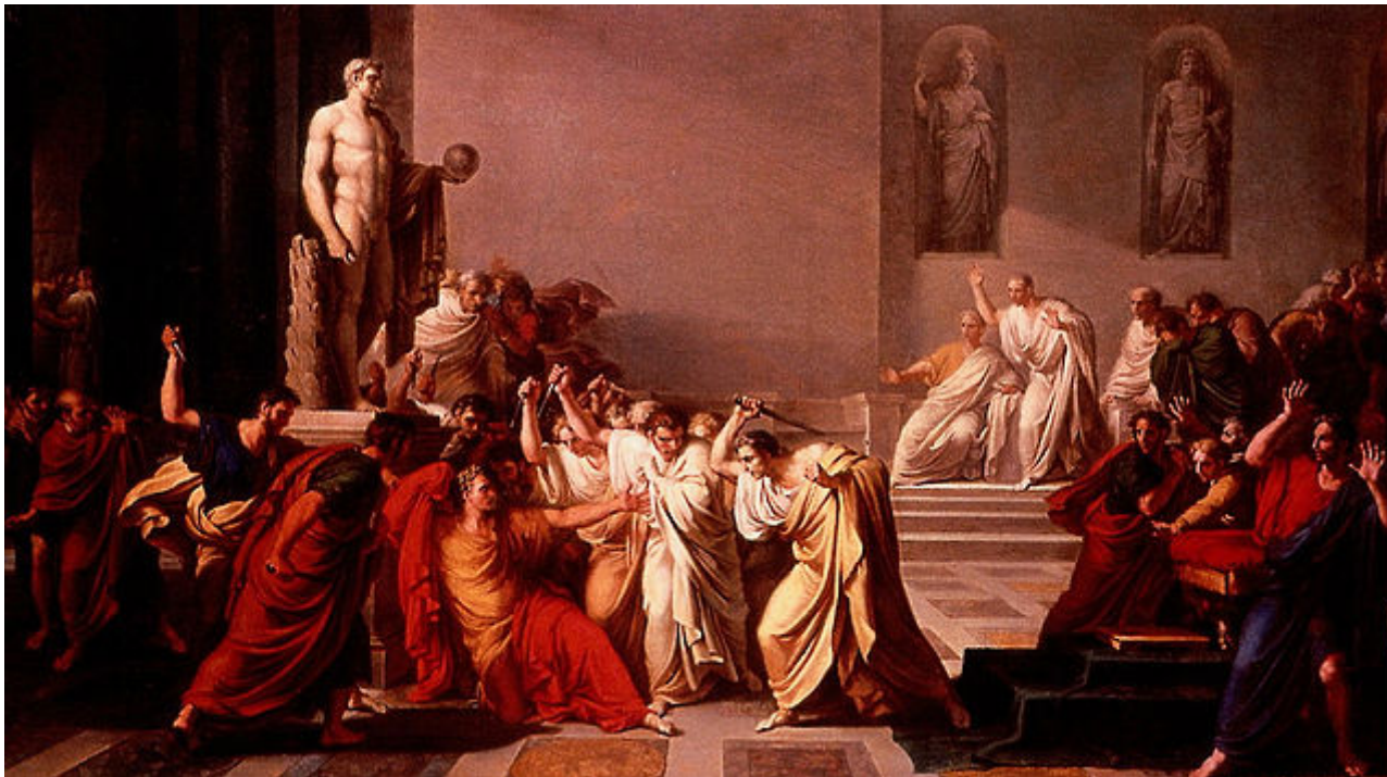
Vincenzo Camuccini: Muerte de César. Galleria Nazionale d'Arte, Roma

Incluiremos, como es habitual, la sección de expresiones latinas y recordaremos una frase del historiador Salustio que refleja la corrupción de la Roma de su época.