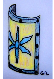
scutum > escudo