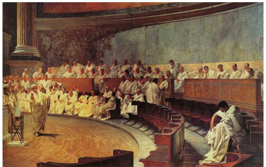
C. Maccari: Catilina es desenmascarado por Cicerón en el senado