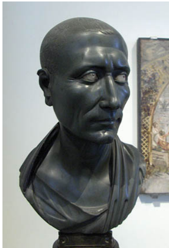
C. Julio César

Tras la intentona golpista de Catilina, los hombres fuertes de la República eran Craso y Pompeyo , pero no lo suficiente. Por ejemplo, el Senado se opuso a conceder tierras a los veteranos de Pompeyo que se habían distinguido en diferentes frentes y en la lucha contra los piratas. Por otro lado, Craso y Pompeyo tampoco tenían tanto poder como para conseguir ser elegidos cónsules juntos, cargo que les habría permitido alcanzar sus objetivos políticos.