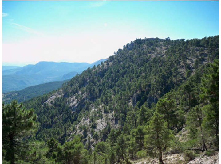
mons montis (m.): monte

"Al amanecer tuvo lugar la batalla debajo de la cima del monte".