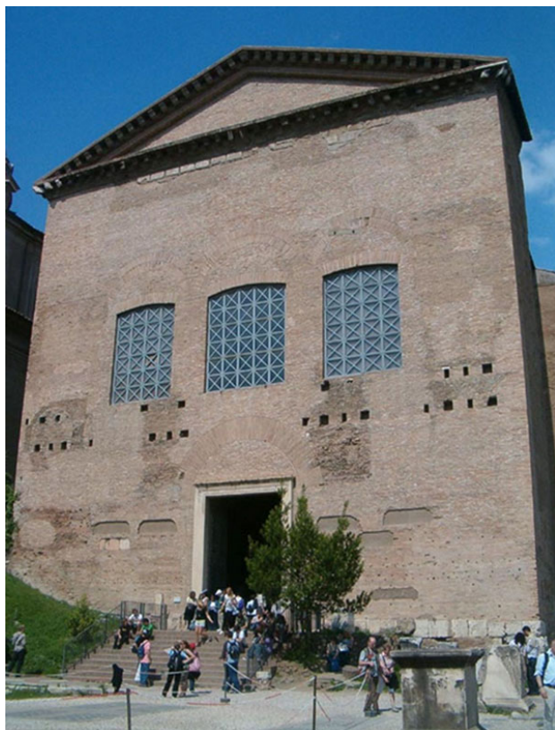
La curia en el forum magnum de Roma Sede del Senado

O tempora, o mores! Esta exclamación del cónsul Marco Tulio Cicerón se hizo proverbial por describir la situación de Roma. Pronunciada ante el Senado en un discurso, que quería desenmascarar un golpe de estado, puso de manifiesto la crisis de la República romana. ¡Qué tiempos, qué costumbres! Efectivamente, la época de Cicerón y de Cayo Julio César fue un periodo difícil, lleno de enfrentamientos y luchas internas por el poder, que llevarán al final de la República y al comienzo del Imperio. También César dejó para la posteridad algunas frases memorables: alea iacta est ("la suerte está echada", pronunciada cuando decidió entrar en Italia con su ejército) o veni, vidi, vici ("llegué, ví y vencí", tras una campaña militar victoriosa). Me alegro de no haber vivido esa época de fuerte inseguridad y de disfrutar, aunque como esclava, de la pax romana.