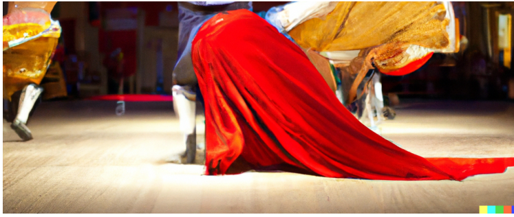
Imagen de elaboración propia generada con Dall-E < https://openai.com/index/dall-e-3/ > . A escena. (CC0 < http://creativecommons.org/publicdomain/zero/1.0/deed.es > )