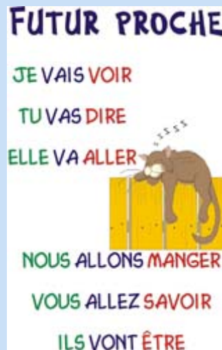
Imagen de producción propia