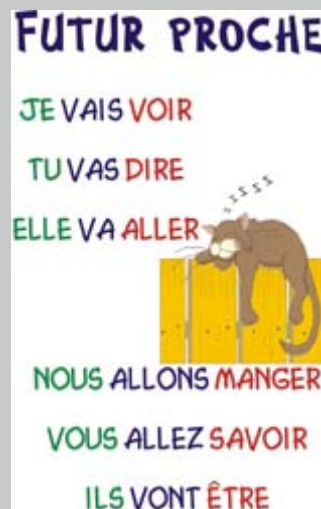
Imagen de producción propia