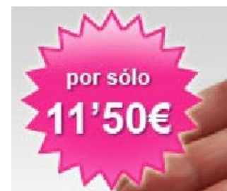
Imagen de elaboración propia