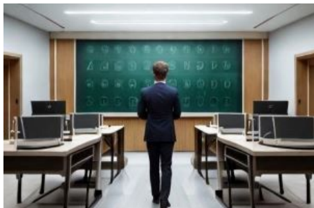
Imagen de elaboración propia generada con Leonardo.AI < https://leonardo.ai/ > . Exponiendo en un aula. (CC0 < http://creativecommons.org/publicdomain/zero/1.0/deed.es > )

Para finalizar, ha llegado la hora de mostrar tu trabajo y cuánto has aprendido .