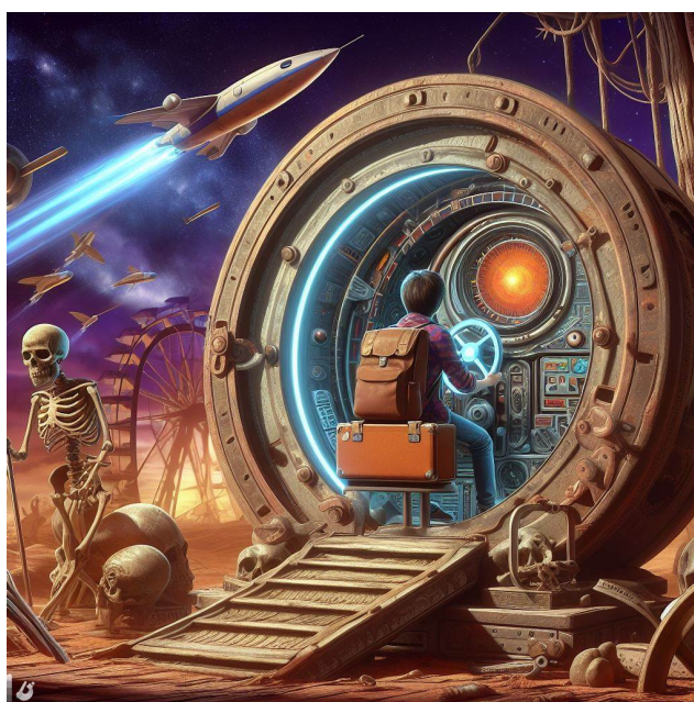
Imagen de elaboración propia generada con Bing Creator < https://www.bing.com/images/create > . Máquina del tiempo. (CC0 < http://creativecommons.org/publicdomain/zero/1.0/deed.es > )

Para ello, tu reto será intentar recrear las primeras manifestaciones rítmicas a través de la percusión corporal y también empleando elementos de la naturaleza como piedras, palos, semillas, etc. A continuación se detallan los requisitos concretos que debes cumplir para superar este reto e intentar ser elegido como miembro de la misión Ganimedes.