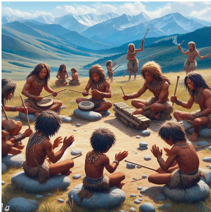
Imagen de elaboración propia generada con Bing Creator < https://www.bing.com/images/create > . Tribu haciendo música. (CC0 < http://creativecommons.org/publicdomain/zero/1.0/deed.es > )