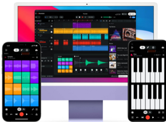
Imagen de BandLab < https://www.bandlab.com > . Imagen de la plataforma BandLab. < https://www.bandlab.com/?lang=es > (BandLab < https://blog.bandlab.com/terms-of-use/ > )

Ya tienes todo lo necesario para empezar tu trabajo. Como se ha comentado, el proyecto lo vas a elaborar mediante la herramienta BandLab , una estación de trabajo de audio digital que puedes utilizar directamente desde el navegador. Aparte del audio que exportarás, elaborarás un pequeño informe en el que indiques alguna de las características de tu creación, según el siguiente esquema: