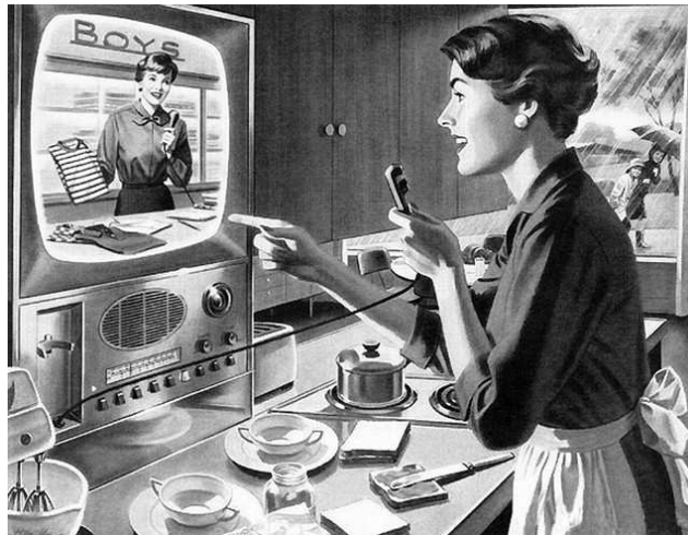
Un anuncio de Toshiba de los años 60 imaginaba cómo serían las comunicaciones del futuro.

No iban tan mal encaminados, ¿no?.