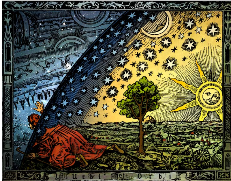
Universum , por Camille Flammarion

Todos los planetas, en cambio, tienen que estar hechos de un material distinto, que no pese. Es el éter, el quinto elemento, ingrávido, sin peso. Por eso los cielos se mueven en la perfección del círculo, y "no nos caen encima". Todo parece lógico, y cada cosa está en su sitio, en un orden perfecto que los cristianos hicieron suyo (a mayor gracia de Dios, creador de este magnífico cosmos).