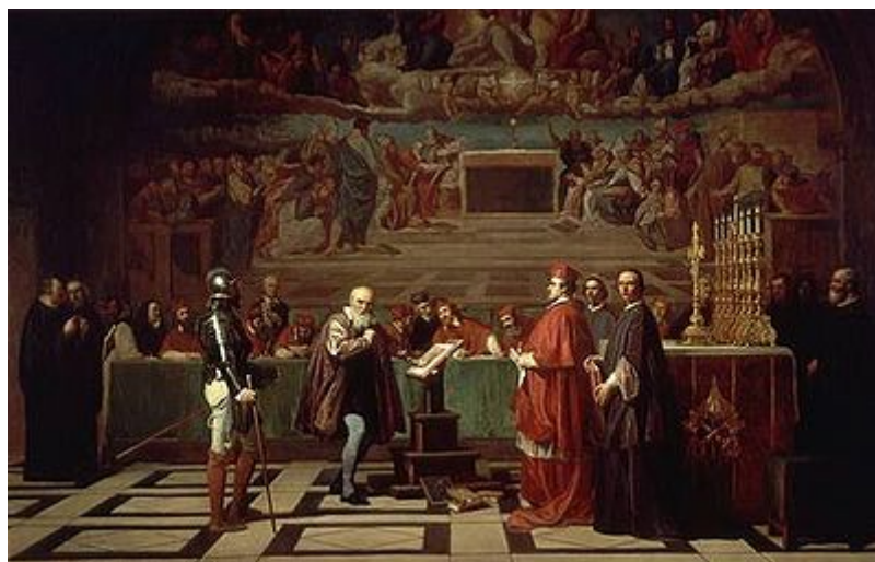
Galileo ante el Santo Oficio. Imagen en Wikimedia Commons , Dominio público

Uno de los graves problemas a los que tuvo que enfrentarse Galileo Galilei fue su conflicto con la doctrina tradicional de la Iglesia, que no veía "con buenos ojos" el nuevo modelo heliocéntrico. Al final del tema haremos una reflexión sobre dicho problema. Ahora, para entender el planteamiento de Galileo, recordemos sus palabras en la carta