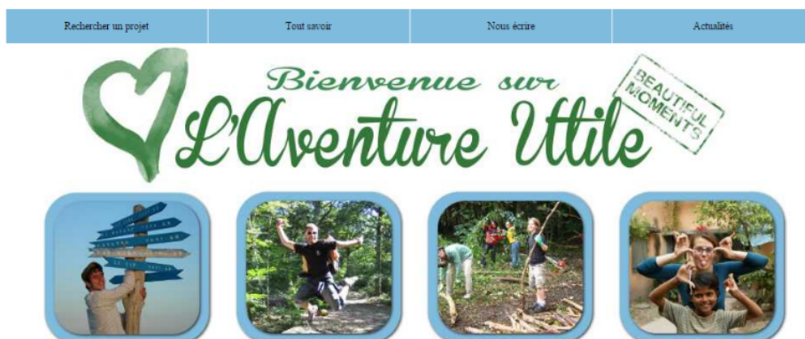
Imagen en aventure utile bajo licencia CC