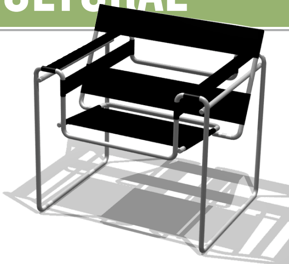
Silla Wassily de Marcel Breuer ( wikipedia )

formado en la Bauhaus. El diseño de la silla fue especialmente revolucionario para la época, por su uso de tubos de acero y su método de fabricación. La estructura original era de acero niquelado, posteriormente cromado, y doblado. El asiento y el respaldo son de cuero, lona o tela.