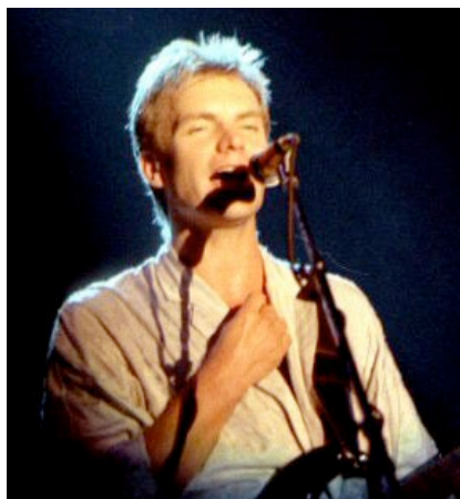
Sting en 1985

La Ópera fue escrita por Bertolt Brecht con música de Kurt Weill y se estrenó el 31 de agosto de 1928 en Berlín. La pieza “con música y un prólogo en ocho imágenes” fue la obra más exitosa en Alemania hasta la toma de poder del partido nazi el 30 de enero del año 1933 y algunas de sus canciones adquirieron gran éxito por sí mismas como la que interpreta Sting, Balada de Mack the Knife .