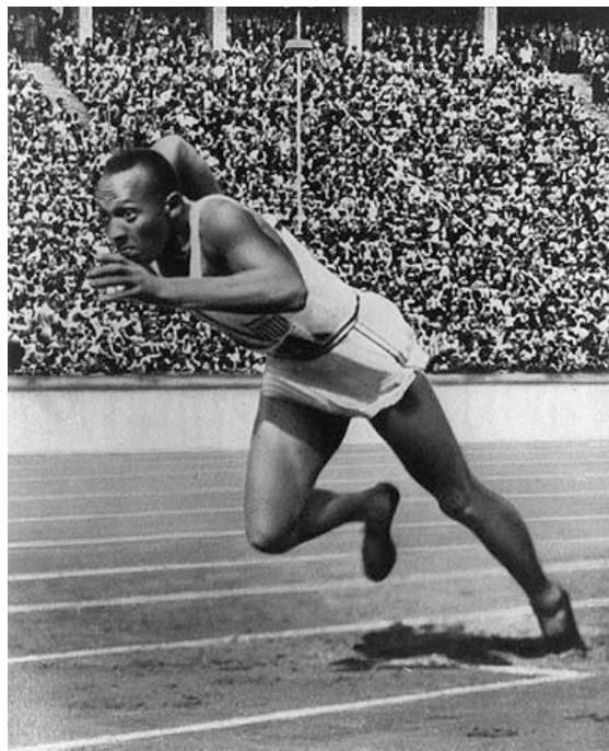
Jesse Owens al inicio de la carrera de 200 metros lisos

JESSE OWENS CONSIGUIÓ EN LOS JUEGOS OLÍMPICOS DE BERLÍN DE 1936 CUATRO MEDALLAS DE ORO: 100 METROS LISOS, 200 METROS LISOS, SALTO DE LONGITUD Y COMO PARTICIPANTE DEL EQUIPO GANADOR EN LA CARRERAS DE RELEVOS 4X100 METROS.