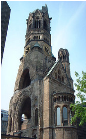
Imagen de nhosko en Flickr . Licencia CC