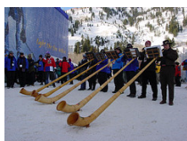
Imagen de Uncleweed en Flickr . Licencia CC

Das Goldene Dachl o "el tejadito de oro" es la atracción turística de Innsbruck, la capital del Tirol austriaco. Fue mandado a construir por el emperador Maximiliano I entre los años 1497 y 1500. Está recubierto de 2.657 tejas doradas y alberga en su interior actualmente el museo Goldenes Dachl.