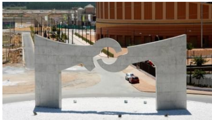
Una imagen de la escultura tomada desde la Autovía A-92.

Este elemento construido, junto a la estructura escultórica taurina que hay situada frente al Coliseo taurino de Atarfe, representan a una ciudad con un fuerte intercambio cultural que ha ido dignificándose. Es también una reivindicación de la emancipación de la periferia sobre la capital.