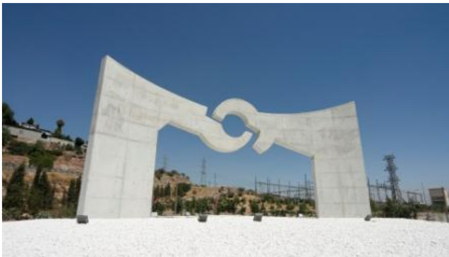
Una imagen de 'La Puerta de las Culturas' finalizada.

Ha recibido una especial atención la posición de las estructuras escultóricas procurando ofrecer el punto de vista más apropiado y su interrelación, de modo que los posibles recorridos, tanto peatonales como rodados, además de funcionales, se nutran de interés. Se trata de un paisaje diseñado y ordenado por la mano del hombre que adquiere una dimensión contemporánea, viva y dinámica.