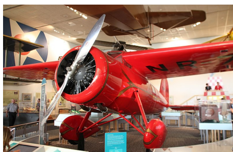
El Lockheed Vega 5b pilotado por Amelia Earhart, en el Museo del Aire y del Espacio en Washington D.C.

Su última aventura fue intentar dar la vuelta al mundo en avión. Un viaje que nunca terminó al desaparecer cuando sobrevolaba el océano Pacífico el 2 de julio de 1937.