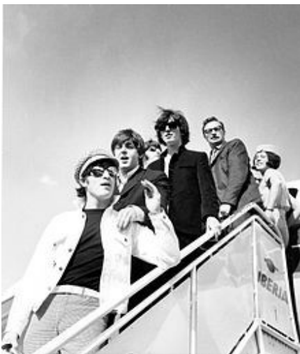
Los Beatles llegando a España en 1965

John formó una banda musical con sus amigos llamada The Quarrymen. Más tarde, conoció a Paul McCartney y George Harrison.