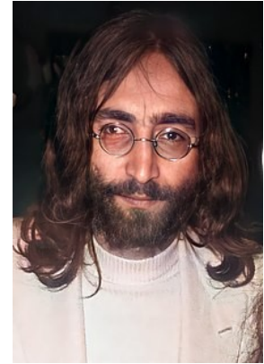
Foto de John Lennon en 1969

Liverpool, donde conocería la música de Elvis Presley y se aficionó a la guitarra.