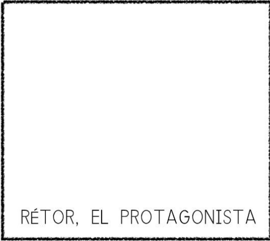
RÉTOR, EL PROTAGONISTA

¿Sabes que Rétor tiene un antagonista? Su nombre es Rétor-no. Es justo lo contrario a él. Sustituyendo las palabras subrayadas de la descripción de Rétor por su antónimo, descubriréis cómo es. ¡Dibújalos y verás la diferencia!